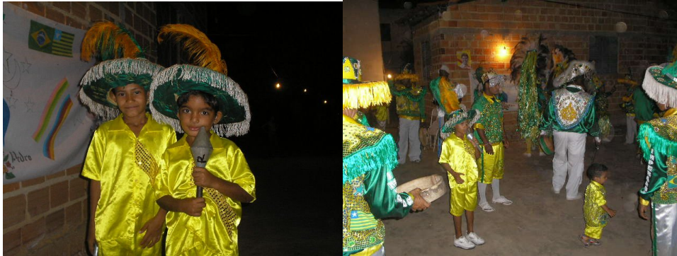
Figura2: Integrantes do Imperador da Ilha Mirim.

conhecimentos que são repassados de geração para geração, como por exemplo, a confecção envolvendo indumentárias, instrumentos e as toadas (como são chamadas as letras das cantigas dos grupos de boi) que são transmitidas para os membros novos dos grupos. Prova da tentativa de manter ativa a cultura do boi é a criação de um grupo formado apenas por crianças da comunidade, são 32 meninas e meninas brincando no Imperador da Ilha Mirim.