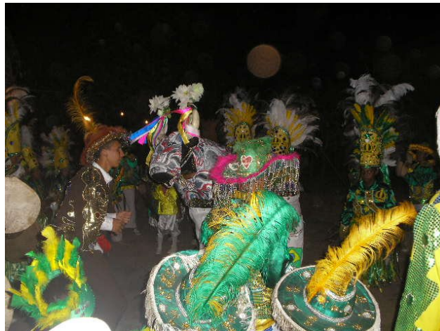
Figura1: Apresentação do grupo Imperador da Ilha.

Os instrumentos que dão sonoridade às toadas do Imperador da Ilha são o pandeiros de couro de bode, a tambor-onça e a chiadeira (maracás). O grupo, fiel à tradição, utiliza instrumentos que são confeccionados por eles mesmos não acrescentando novos tipos de sonoridade como outros grupos. O ritual acontece durante o ano inteiro, com confecção dos trajes, preparação de toadas, feitura do boi e os ensaios que começam em maio até o grande dia da morte e ressurreição do boi que acontece no último domingo de agosto.