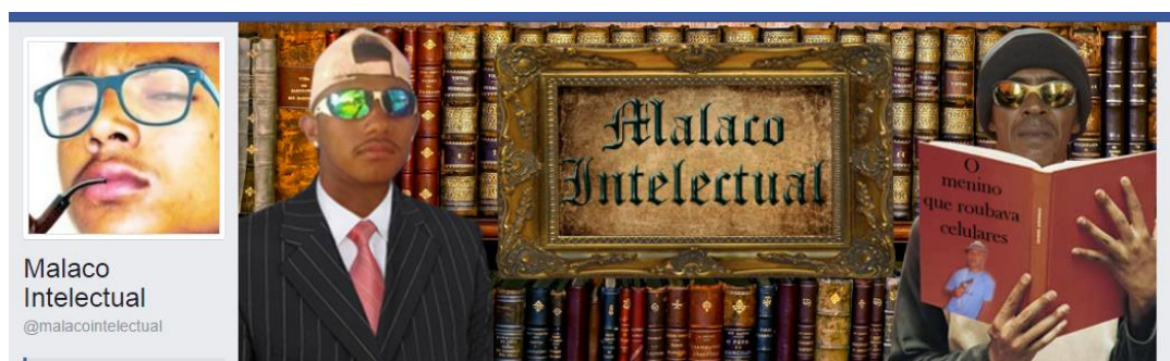
Imagens 8. Captura de tela do topo da página “Malaco Intelectual”

Até mesmo uma página de humor utiliza a imagem de Alanzinho em seu perfil: a “Malaco Intelectual”, criada na capital paraense: