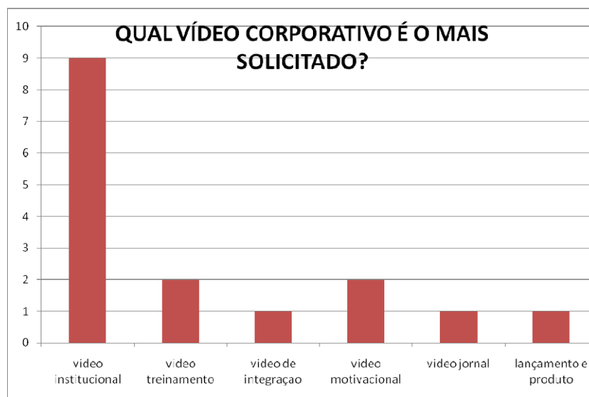
Gráfico 2: Qual o tipo de vídeo corporativo é o mais solicitado.

O segundo gráfico refere a qual vídeo corporativo é o mais solicitado, sendo que todos os entrevistados responderam que o vídeo institucional é um dos mais solicitados pelas organizações. Entretanto, 2 entrevistados assinalaram também a opção vídeo motivacional e vídeo treinamento. E com um voto ficaram as opções: vídeo integração, vídeo jornal, vídeo de lançamento e/ou produto.