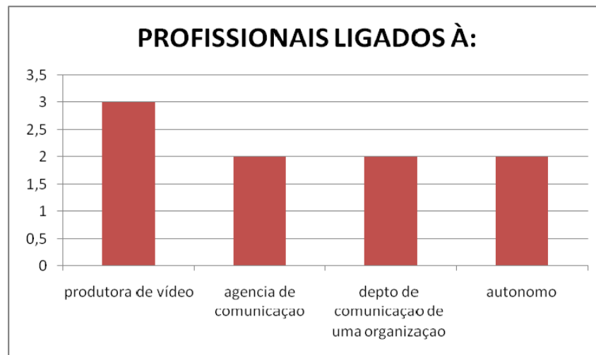
Gráfico 1: Perfil dos entrevistados

O segundo gráfico refere a qual vídeo corporativo é o mais solicitado, sendo que todos os entrevistados responderam que o vídeo institucional é um dos mais solicitados pelas organizações. Entretanto, 2 entrevistados assinalaram também a opção vídeo motivacional e vídeo treinamento. E com um voto ficaram as opções: vídeo integração, vídeo jornal, vídeo de lançamento e/ou produto.