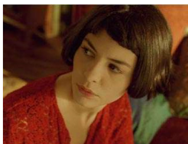
FIGURA 03 – AMÉLIE POULAIN

Still do filme “O Fabuloso Destino de Amélie Poulain” (2001) de Jean-Pierre Jeunet.