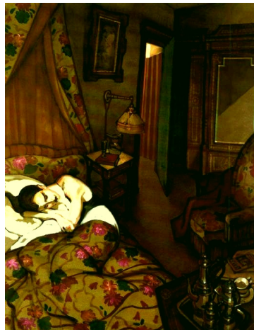
Detalhe do quadro “ Sommeil de rêves ” (1997) de Juarez Machado.