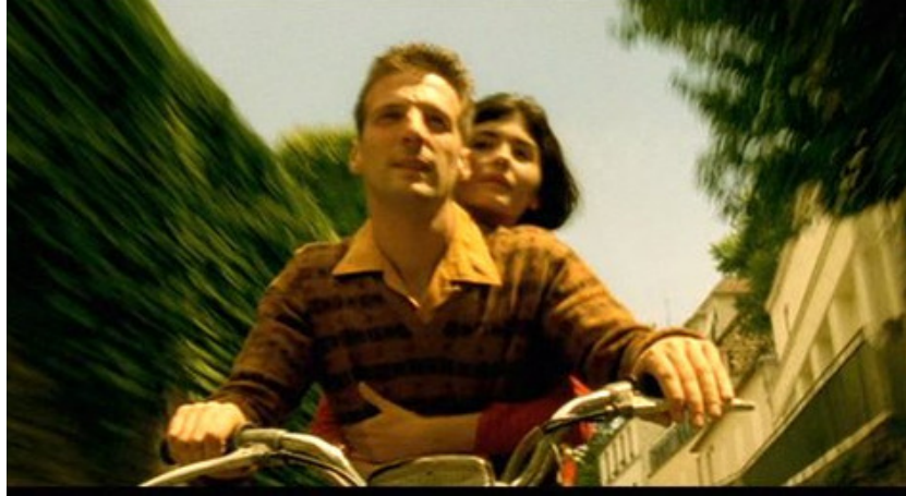
Still do filme “O Fabuloso Destino de Amélie Poulain” (2001)