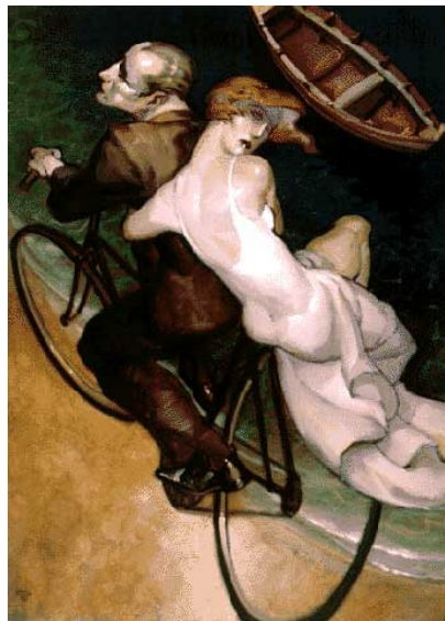
Quadro “Lances de poesia em Santo Antonio de Lisboa” (1997) de Machado.

O significado subjacente tem importância na história, seja moral, social, religiosa, e os personagens são frequentemente personificações de ideias abstratas, como amor, caridade, cobiça, ou inveja. E também de ideias que em um quadro podem ser transmitidas abstratamente, como música, temperatura, movimento; que em um filme se encontram visualmente presentes. Ainda que a alegoria tenha relação direta com o símbolo, são duas coisas distintas. Portanto, doravante em trabalhos que