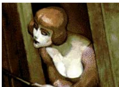
FIGURA 04 – PERSONAGEM FEMININA