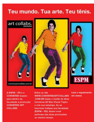
Figura 3 : cartaz

Observa-se ainda que os cartazes (figura 3) foram colados de forma segmentada, criando uma espécie de teaser (FIGUEIREDO, 2005), ou seja, de início causando curiosidade e, em momento posterior, tendo uma parte sua substituída por informações diretas acerca do concurso Art Collabs.