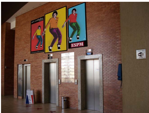
Figura 1 : Foto aplicação banner gigante

estratégias foi investir em banners gigantes que repetiam uma sequência de imagens de professores..