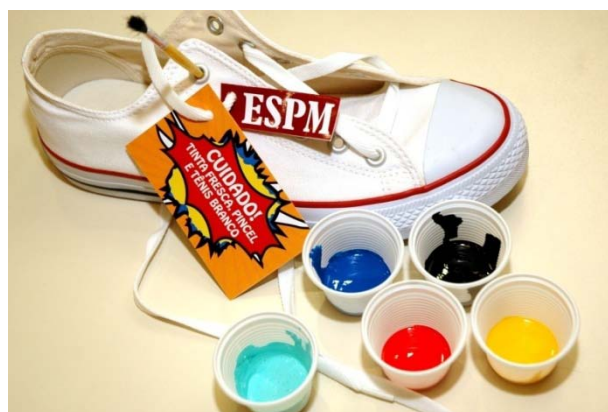
Figura 4 : tênis para a ação

Os alunos entenderam a proposta e, sem precisar de instruções, pintaram os tênis. Como as ações muitas vezes extrapolam as expectativas, foi interessante observar que em algumas vezes essa ação era feita em grupo, e, em outras, eles complementavam o material, tirando do próprio estojo canetas hidrográficas coloridas para personalizar ainda mais seu modelo. Alguns alunos trabalharam até mesmo as solas, cadarços e parte interna. Dessa forma, sentiram-se motivados a tentar personalizar também o modelo virtual, proposta do concurso (figura 5)