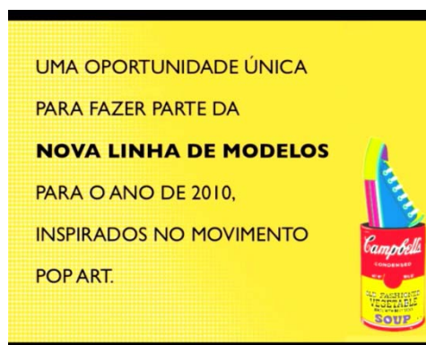
Figura 2 : frames do vídeo

Observa-se ainda que os cartazes (figura 3) foram colados de forma segmentada, criando uma espécie de teaser (FIGUEIREDO, 2005), ou seja, de início causando curiosidade e, em momento posterior, tendo uma parte sua substituída por informações diretas acerca do concurso Art Collabs.