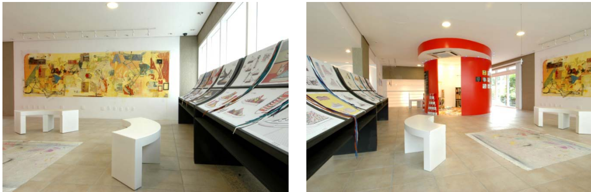
Figura 8 : fotos exposiçao

Para finalizar, é importante ressaltar que – fora a exposição, obra do artista plástico – toda a campanha interna do Converse Art Collabs ESPM foi planejada, criada e implementada por alunos da graduação. Desde pesquisa, até fotografia e maquiagem, tudo foi feito por alunos que tiveram uma bela oportunidade de trabalhar de forma muito integrada ao mercado, pois trabalharam com materiais e orçamentos que vinham de um cliente real, exteno à escola; além disso, toda a criação deveria ser previamente submetida e aprovada pela comunicação da própria Converse.