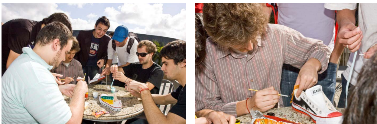
Figura 5 : alunos pintando seus converse

Os alunos entenderam a proposta e, sem precisar de instruções, pintaram os tênis. Como as ações muitas vezes extrapolam as expectativas, foi interessante observar que em algumas vezes essa ação era feita em grupo, e, em outras, eles complementavam o material, tirando do próprio estojo canetas hidrográficas coloridas para personalizar ainda mais seu modelo. Alguns alunos trabalharam até mesmo as solas, cadarços e parte interna. Dessa forma, sentiram-se motivados a tentar personalizar também o modelo virtual, proposta do concurso (figura 5)