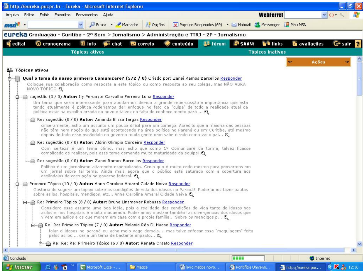
Figura 2 – Tela do computador captada em 12 de outubro de 2005 mostra como os alunos e professor definem pelo debate o tema básico de cada edição do Comunicare. O contador do Fórum do Eureka registrava 572 colaborações.

Decidido o tema, há nova rodada de discussões no Fórum para se definir as pautas de cada editoria. Segue-se o planejamento da edição como um todo e o de cada editoria. As editorias estipulam quantas e quais matérias serão produzidas, seus entrevistados, as melhores fontes, quem fará as reportagens, fotografias, diagramação etc. Na sequência, o jornal é paginado em sala de aula.