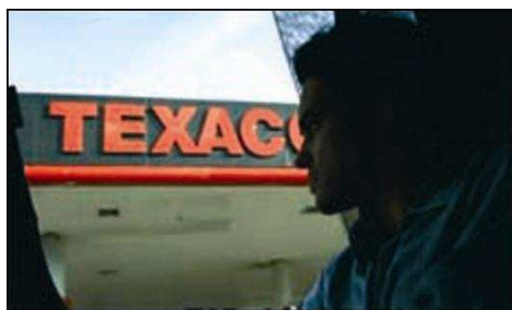
Figura 1: Merchandising Texaco