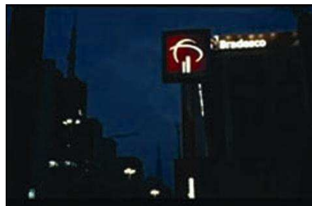
Figura 2: Merchandising Bradesco