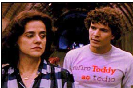
Fig. 3: Merchandising da marca Toddy

Sinopse: O filme do eterno poeta Cazuza relembra momentos marcantes de sua vida. O início da carreira, a ascensão com Barão Vermelho e a carreira solo debilitada pela doença.