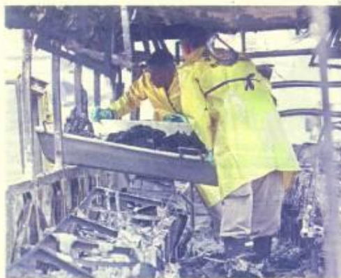
INCENDIO. SOCORRISTAS RETIRAN RESTOS DE UN ÓMNIUS QUEMADO EN LA FAVELA CIDADE ALTA.

► Un grupo armado tomó un ómnibus y lo incendió con la gente dentro. Quemaron más de una docena de vehículos y hubo tiroteos en barrios ricos. Hay varias hipótesis sobre los motivos de la ofensiva.