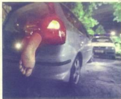
MUERTE. EL CADÁVER DE UN NARCOS EN EL BUL DE UN CÓDICE EN LA ZONA DESTE DE RIO.