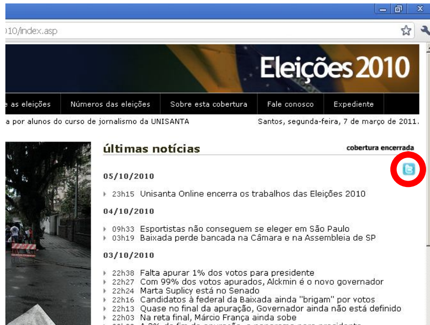
Figura 4 – Menções à cobertura experimental realizada pelos alunos