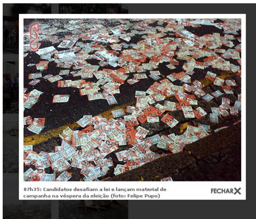
Figura 2 – Foto extraída da galeria de imagens das Eleições 2010, totalmente produzida pelos estudantes

Já em relação às imagens ( http://www.online.unisanta.br/eleicoes2010/imagens.asp ), o produto apresenta uma galeria diversificada, abordando assuntos variados que vão da propaganda irregular à votação de candidatos, revelando ao leitor o clima do dia da eleição (figura 2).