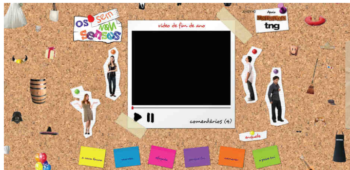
Ilustração 2 - Esboço da página inicial

interação, como, por exemplo, um chapéu que poderá ser movido e colocado em cima de qualquer foto.