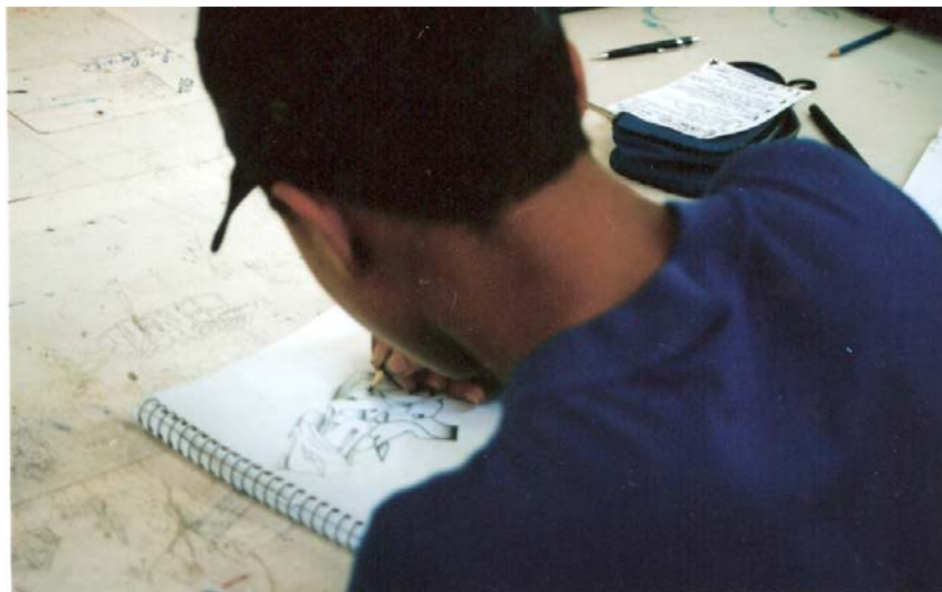
Oficina de grafite