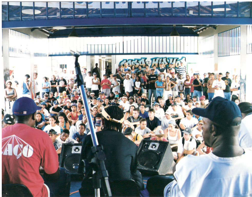
Palestra do grupo Z'África Brazil para o público da Casa