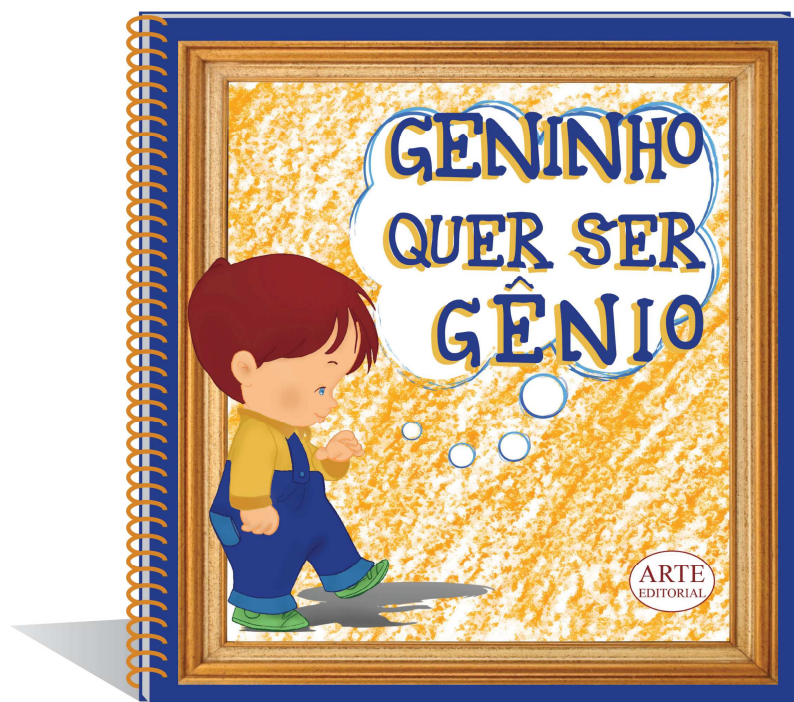
Ilustração 1: Capa do livro.

“Geninho quer ser gênio” almeja ser, como citado anteriormente, apenas o precursor de uma coleção que introduz a vida e a obra de grandes artistas, nesse caso específico, Vincent Van Gogh. Para tanto, narra fatos importantes de sua vida e do contexto geosocial ligados às características de sua pintura. Ao longo do livro, foi chamada a atenção para pontos como as cores usadas por ele, a razão delas e os motivos de suas pinturas.