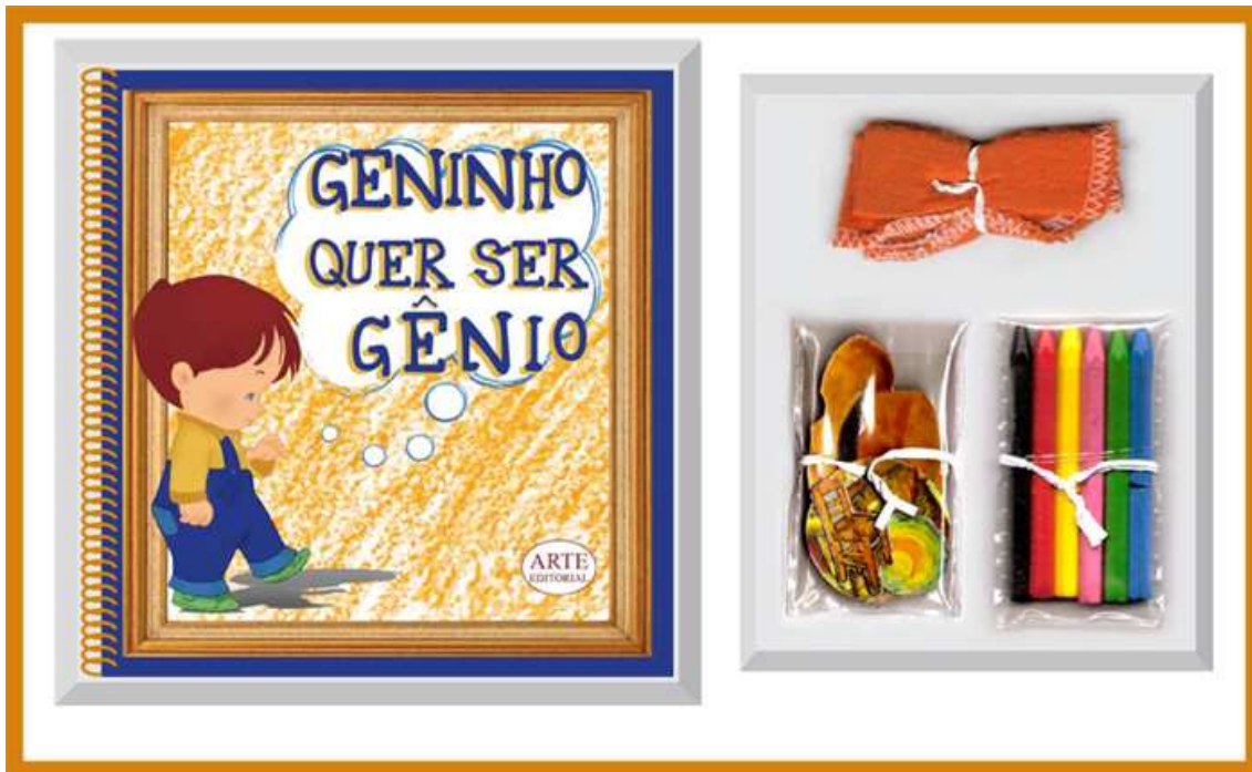
Ilustração 2: Kit Geninho quer ser gênio.

A capa foi inspirada nas cores recorrentes na produção artística de Van Gogh e na possibilidade de brincadeiras que o livro-brinquedo oferece por meio do giz de cera e da fórmica, permitindo a vazão do furor criativo que permeia a mente imaginativa dos pequenos leitores. A própria ilustração de Geninho foi trabalhada de modo a facilitar o reconhecimento das características físicas do pintor, como seus cabelos ruivos, por exemplo.