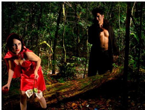
Chapeuzinho encontra-se com lobo mau