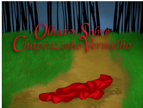
Olhares Sobre Chapeuzinho Vermelho