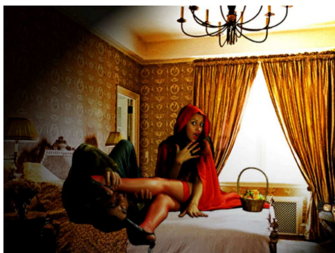
Lobo Mau ataca chapeuzinho vermelho