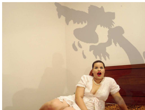
Lobo Mau entra na casa da vovozinha