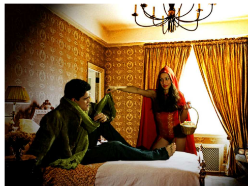
Chapeuzinho vê lobo mau na cama da vovó