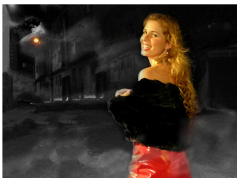
Chapeuzinho comemora a morte do Lobo Mau

A tradução intersemiótica pode ser entendida como a técnica de “desconstrução” de manifestações artísticas e estéticas pré-existentes em estruturas conhecidas, mas nunca esgotadas ou limitadas, o que possibilita as intervenções intersemióticas.