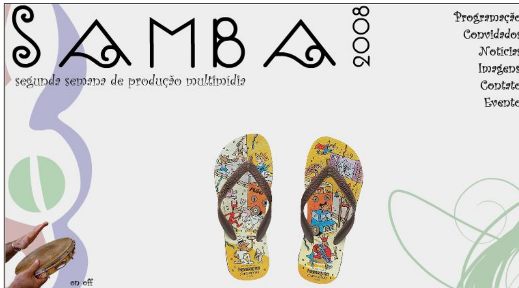
Figura 1: Página inicial do “Samba 2008 – II Semana de Produção Multimídia”