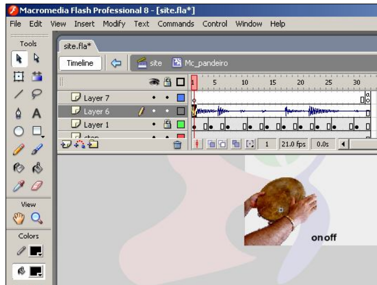
Figura 3: Movie clips criados pelos estudantes

permitir o carregamento e a reprodução deste site também a partir de CD-ROM. Para a abertura do trabalho, bem como para a implementação da trilha sonora, em consonância com a concepção geral do produto, os alunos foram levados a pesquisar e a