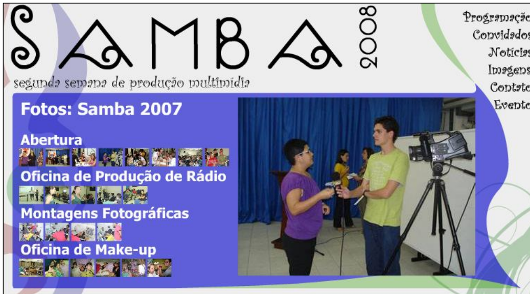
Figura 4: Seção de fotos da Primeira Semana de Produção Multimídia (SAMBA 2007)

Foi também implementada uma área de imagens capaz de ilustrar os eventos realizados como parte da I Semana de Produção Multimídia (2007):