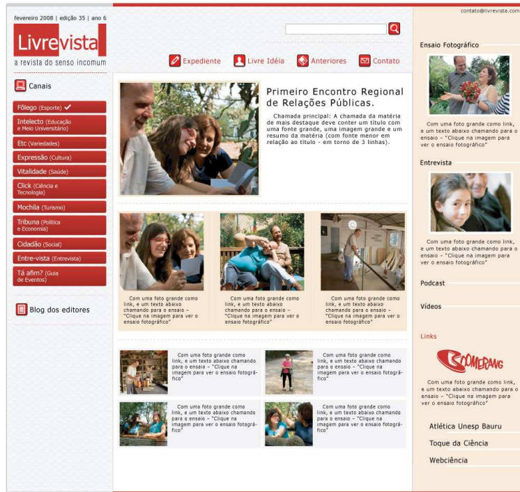
Página inicial (I) – Home disponibiliza todo o conteúdo da edição, de forma limpa e dinâmica

Ao abrir uma matéria, a página exibe o texto, os links para os demais fragmentos, e botões de acesso a todos os outros canais. No final da matéria, há espaço para a postagem de comentários.