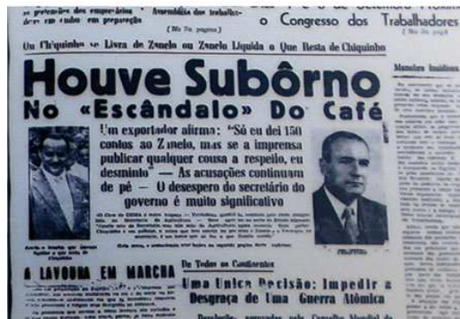
figs. 02 e 03 – Primeiras páginas Folha Capixaba. Dia 27 de junho de 1957 e 22 de março de 1958, respectivamente. Pode-se ver, pela escolha tipográfica, o tratamento hierárquico da informação conferido aos títulos das primeiras páginas da Folha Capixaba.

Diferentemente dos dias atuais, não havia um padrão ou projeto gráfico que definisse qual tipo de fonte deveria ser usada para apresentação das manchetes do jornal. A escolha, tanto de tamanho quanto de famílias, era feita na hora da montagem das páginas do periódico, explicitando o caráter pessoal das escolhas, já que a tipagem 8