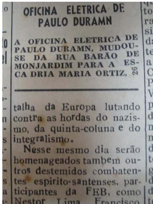
FIG. 04 – página interna Folha Capixaba. 13 de junho de 45. Os tipos em falta (que são repostos por outros) e os gastos conferem uma textura heterogênea ao texto.

Escolher e organizar os caracteres para as matérias em composição tipográfica nesse jornais ainda traria consigo uma consequência interessante: o erro no ato da composição .