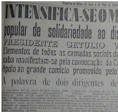
FIG. 01 – Primeira página Folha Capixaba. 09 de outubro de 1945

Por esse motivo, era comum que as primeiras páginas das edições chamassem atenção pelo uso de títulos garrafais e com uma considerável variação de famílias.(fig.01)