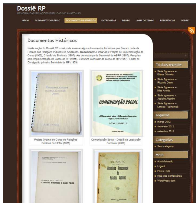
Fig. 03 Documentos Históricos

- Documentos Históricos: Nesta seção do Dossiê RP pode-se acessar alguns documentos históricos que fizeram parte da História do Curso de Relações Públicas da UFAM. Implementação do Curso (1965), Criação da Associação Amazonense de RP (1967), Ata de mudança da Seccional da ABRP (1967), Pesquisa para Implementação do Curso de RP (1965), Estrutura Curricular do Curso de RP (1967), Folder de Divulgação primeiro Seminário de RP no Amazonas (1969).