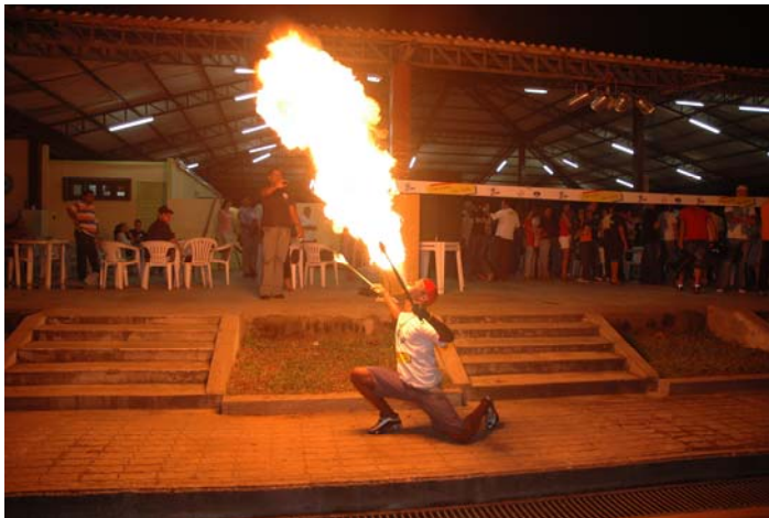
Figura 2 ( Artistas Circenses)