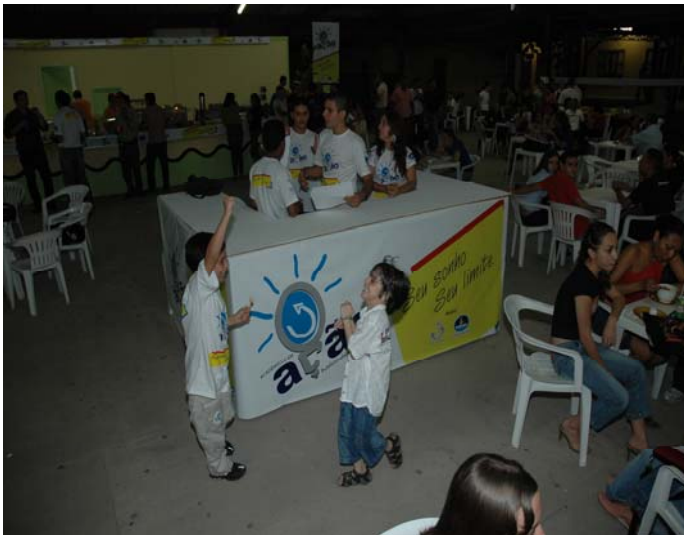
Figura 5 ( Stand caracterizado)