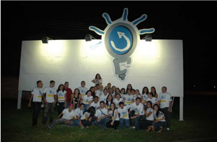
Figura 1 (teaser – outdoor)