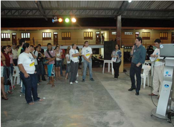
Figura 7 ( Direção Acadêmica)