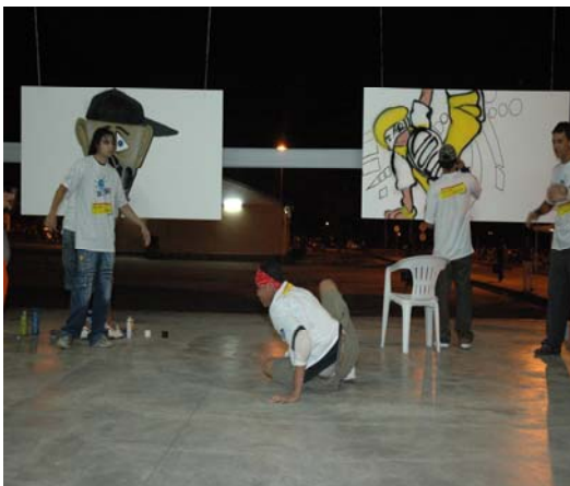
Figura 6 ( Telas grafitadas)