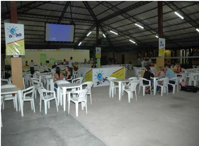
Figura 4 ( Área de Convivência )