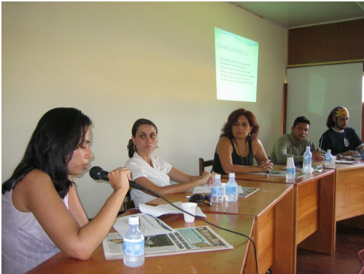
Foto da Mesa Redonda Segundo dia