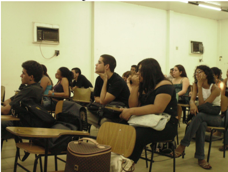
Platéia no Quinto Dia.