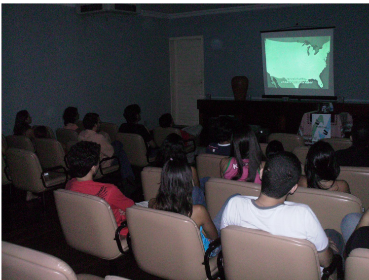
Platéia do terceiro dia