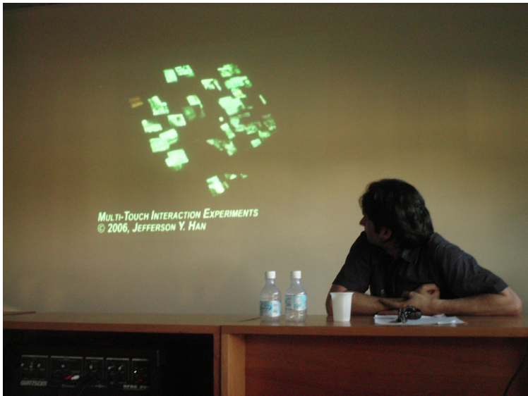
Mesa Redonda do Quarto Dia