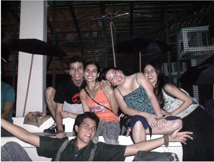
Festa de Encerramento