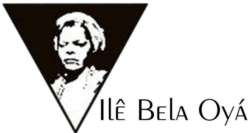
Anexo 01: Logomarca