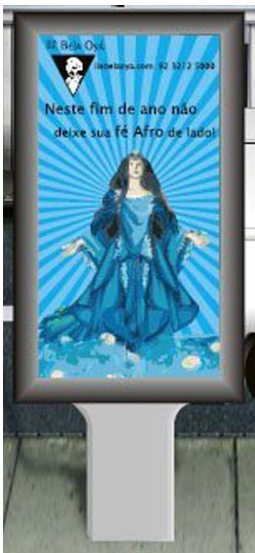
Anexo 02: Mobiliário urbano