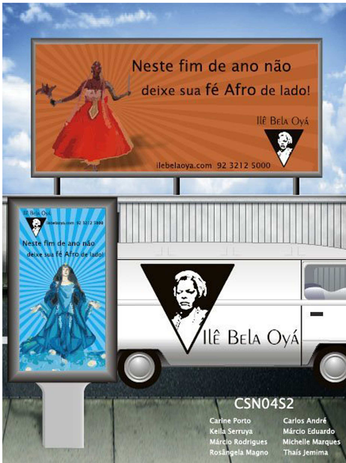
Anexo 04: Banner usado para a apresentação