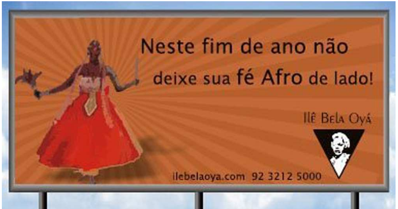
Anexo 03 : Outdoor