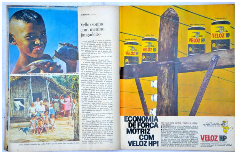
Fig. 5: Uma vela contra o mar (pp. 50 – 51)

Por fim, na última página (fig. 5), a imagem que se destaca é uma espécie de retrato da família, no qual grande parte dos familiares de Pedro se encontra em frente a uma casa de taipa, estruturada por meio do trançado de palhas e pedaços de madeira. Além disso, a reportagem é encerrada dando ênfase à imagem de uma criança feliz, carregando o peixe vindo recentemente do mar.