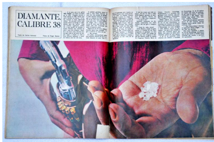
Fig. 6: Diamante, calibre 38 (pp. 84 – 85)

De forma semelhante com o que falamos anteriormente, a imagem de abertura da reportagem intitulada “ Diamante, calibre 38 ”, de julho de 1966, é uma fotografia que ocupa cerca de três quartos das páginas. O espaço restante é ocupado por texto e, especialmente, com o título da matéria. Vale destacar que a fotografia trás três elementos principais: uma mão calejada pelo trabalho pesado, diamantes relativamente brilhantes e uma arma carregada. Sendo estes os elementos que se ligam diretamente ao texto, no entanto, não se faz possível afirmar que o título tenha sido pensado tendo a imagem como referência (fig. 6).