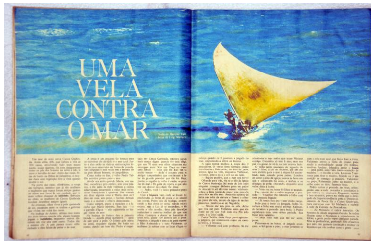
Fig. 1: Uma vela contra o mar (pp. 42 – 43)

A imagem de abertura da reportagem “Uma vela contra o mar”, ambas realizadas na praia de Canoa Quebrada, no estado do Ceará, ocupa cerca de dois terços da página, deixando apenas uma tira de texto abaixo do imenso mar azul. As letras do título estão sobrepostas à imagem, na cor branca e em uma espécie de simetria com a página seguinte, onde, também num tom mais claro (amarelada), está uma jangada. Texto e imagem dialogam diretamente, especialmente no que tange ao título (fig. 1).