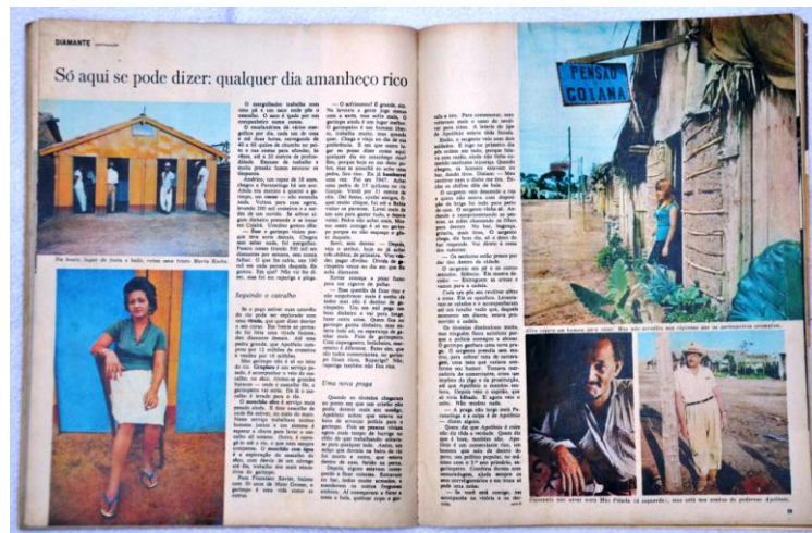
Fig. 8: Diamante, calibre 38 (pp. 88 – 89)

Além disso, alguns personagens são apontados ao longo do texto, humanizando um trabalho que se mostra extremamente violento e perigoso. De forma semelhante, nas duas páginas seguintes (fig. 8), quatro destes são apresentados aos leitores, a maior parte com uma espécie de cenário característico de sua vida. Destacamos as fotografias de duas mulheres, em condições sociais completamente distintas, que compõem a narrativa: ao passo que a da página da esquerda vive do desejo dos garimpeiros, a da direita sonha com um futuro diferente, ter um marido e sair daquele lugar. O texto é dividido por subtítulos, que em alguns casos podem ser entendidos como subtemas do texto.