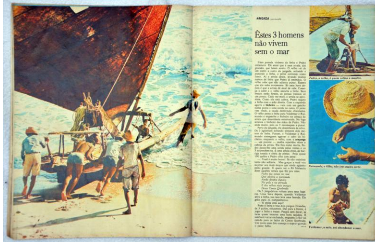
Fig. 2: Uma vela contra o mar (pp. 44-45)

Nas páginas seguintes, as imagens apresentam ao leitor os três personagens principais da reportagem: Pedro (o mais velho), Raimundo (filho de Pedro) e Valdemar (filho de Raimundo). A mesma família vista na página ímpar, na página par aparece pondo sua jangada no mar, dando início ao dia de pescaria. No alto da página, os dizeres: “Êstes 3 homens não vivem sem o mar” (fig. 2).