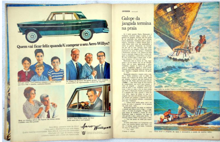
Fig. 4: Uma vela contra o mar (pp. 48 – 49)

Na próxima página da reportagem (fig. 4), é chegada a hora de sair do mar. Ao mesmo tempo em que o texto fala dos preparativos do retorno para a costa, como a salgadura do peixe e mesmo a volta a terra, as imagens já retratam a jangada sendo manobrada e levada à praia.