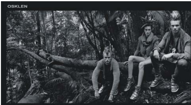
Figura 1: anúncio da campanha de lançamento da coleção inverno 2007 da Osklen - Guardiões da Amazônia.

Integrando temas como a natureza, a cultura e a sociedade, associados a uma estética apurada, a Osklen conseguiu ganhar espaço no mercado não só como grife, mas como um veículo de comunicação desse estilo de vida.