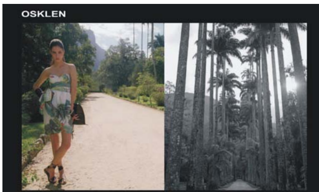
Figura 5: anúncio da campanha de lançamento da coleção Verão 2006 da Osklen - Rio de Janeiro.