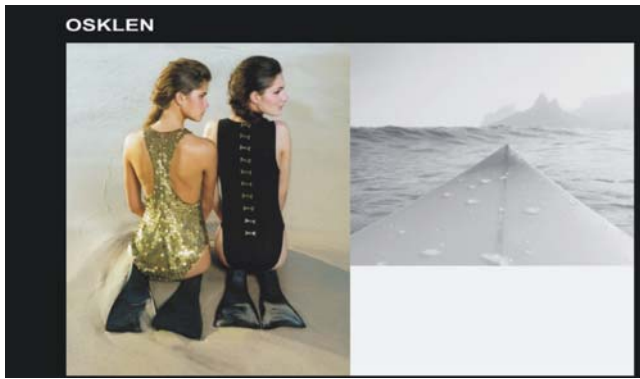
Figura 4: anúncio da campanha de lançamento da coleção Verão 2006 da Osklen - Rio de Janeiro.