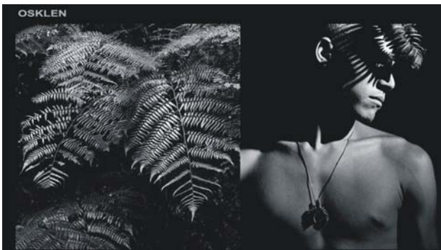
Figura 3: anúncio da campanha de lançamento da coleção inverno 2007 da Osklen - Guardiões da Amazônia.