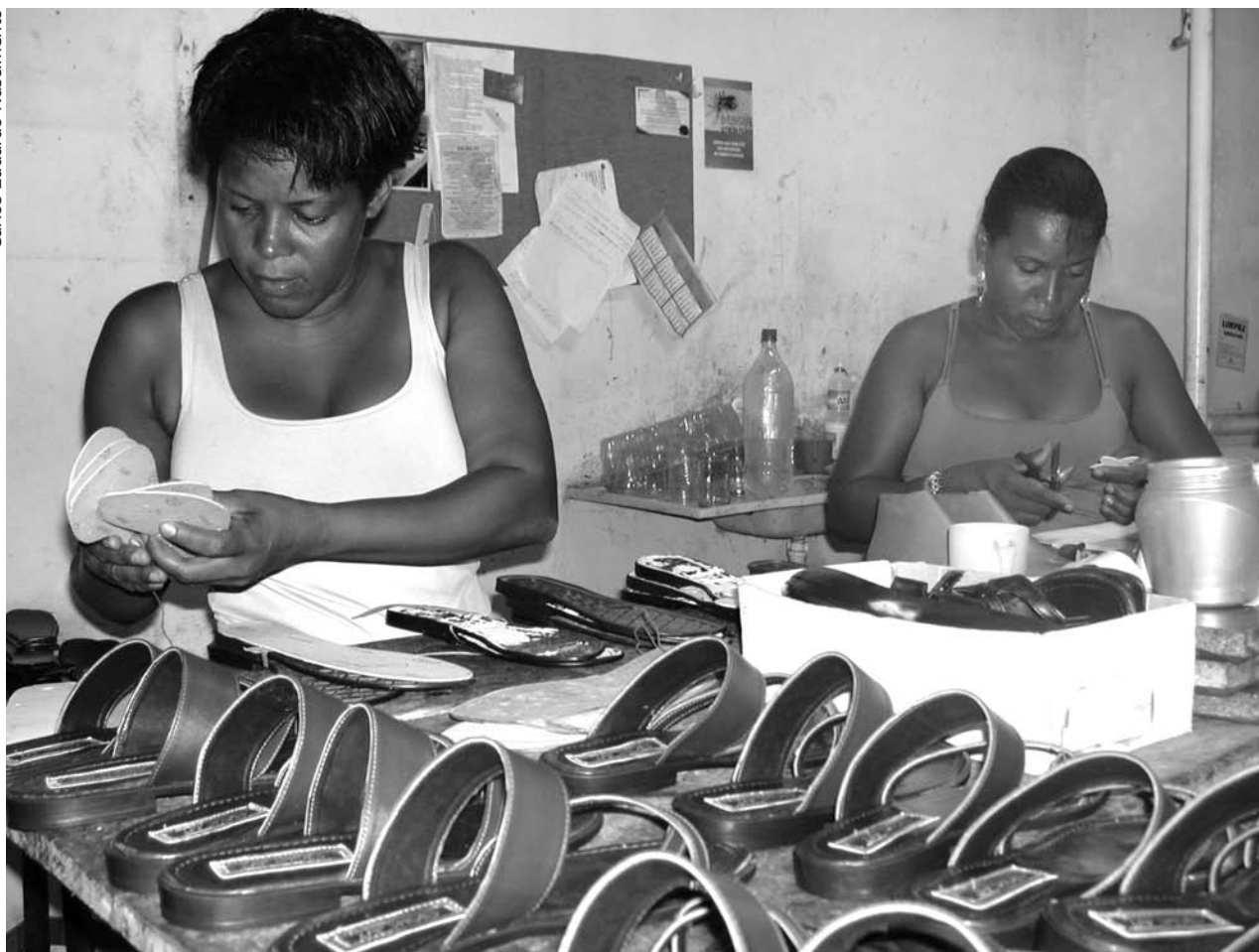
Cooperativa Colibris leva renda e profissionalização para a comunidade

mento para separação de garrafas PET na comunidade, há ainda concorrência direta com o ferro-velho que funciona ao lado e elevou o valor pago por quilo de garrafa de plástico, obrigando a ONG a pagar mais caro pela matéria-prima.