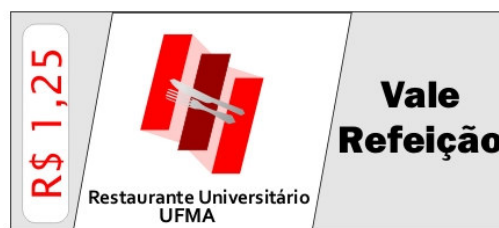
Figura 4: Ticket