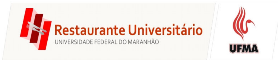
Figura 1: Logomarca