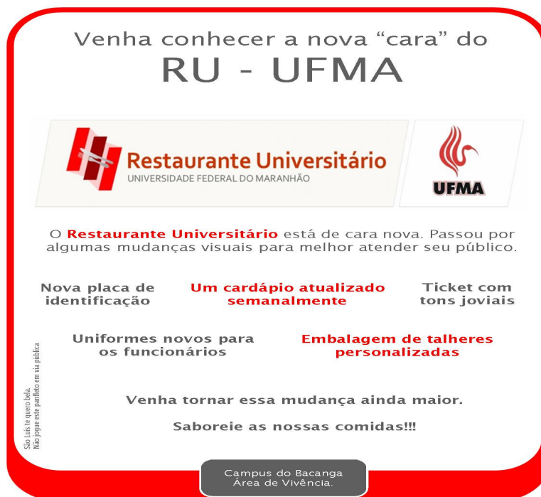
Figura 7: Flyer

O flyer será impresso em papel couché , no formato “metade A4”. Esta pela será estratégica na divulgação da nova identidade do RU, pois trará informações sobre as mudanças ocorridas na comunicação visual do restaurante, além de um convite a novos freqüentadores. Utiliza-se de cores de acordo com as utilizadas na logomarca, a fim de torná-lo chamativo, com um toque de suavidade.