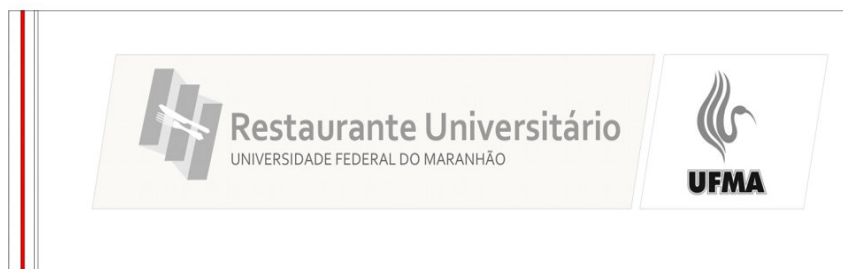
Figura 5: Embalagem para talheres

A embalagem será de saco plástico, apenas com a logomarca do Restaurante Universitário impressa em marca d'água. Pensou-se em guardanapos de panos, mas por questões higiênicas e financeiras, seria inviável. A proposta é uma maneira simples, barata e eficaz de tornar as refeições atrativas.