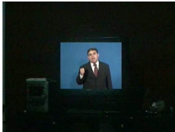
Noticiário de mais um furto