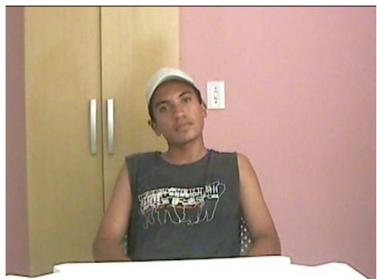
Jardineiro na Entrevista