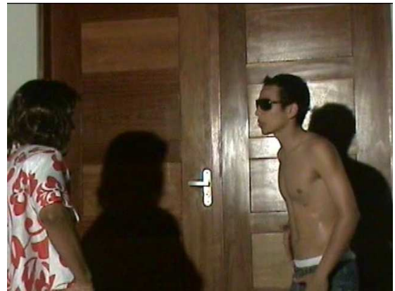
Palhaço encontra Go Go boy