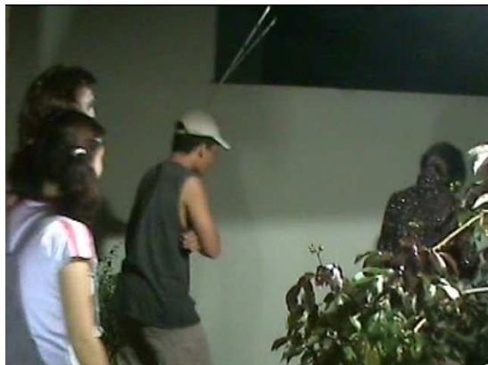
A Quatrilha ao plano