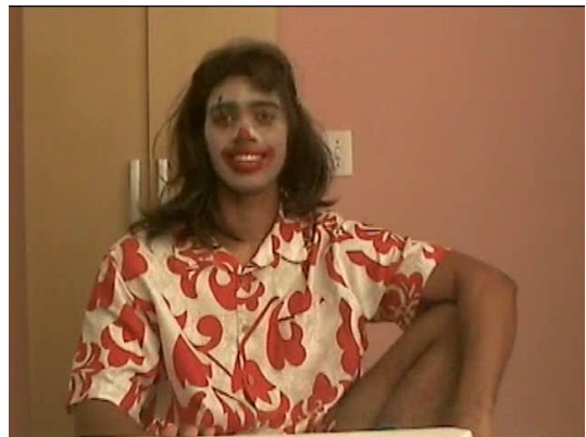
Palhaço Xulezinha na Entrevista