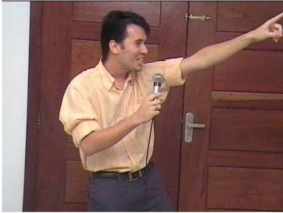
Funcionário da Empresa de Despedida de Solteiro