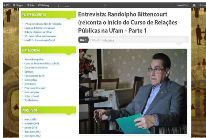
Fig. 02 Entrevistas

-Entrevistas: Estão disponibilizadas no blog 8 entrevistas em diversos formatos (áudio, vídeo e textos). As entrevistas levam em conta os mais diversos aspectos sobre o Curso de Relações Públicas (Aspectos Históricos, Criação do Curso, Egressos). Nas entrevistas buscamos respeitar os princípios éticos dos Direitos Autorais e de Imagem, além disso, destacamos os créditos dos entrevistados e buscamos a comprovação da documentação e de fontes confiáveis para certificar a veracidade das informações.