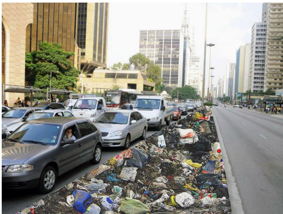
Figura 2: Layout de mobiliário urbano Isso é o que você faz quando joga lixo no chão - rua Fonte: criado pelo autor