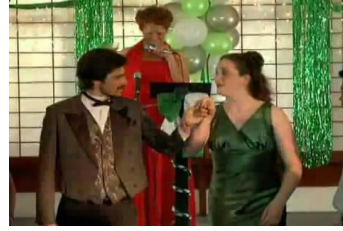
Figura 6- O ator chegando ao baile como príncipe.