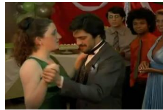
Figura 4- Letícia dançando a valsa com o ator Caco Klein em seu baile.

Aurélia tem sua vida alterada no momento do baile, onde finalmente ela e Seixas dançando uma valsa, rodopiando num êxtase crescente, permitem que seus corpos se encontrem, ainda que sutilmente, depois de meses de uma rotina tortuosa de casamento. É justamente no baile que se potencializa a enleavação conjunta da carne e do espírito de amantes de ambos. E no roteiro da TV, é no baile que Letícia encontra Caco Klein, ator que representa Seixas na novela “As correntes da paixão”. Interessante salientar que em dois momentos do episódio a personagem defende o ator dos amigos que ludibriam sua atuação como Seixas, mas não assume sua paixão por ele por vergonha. Tal como Aurélia, Letícia passa a narrativa buscando esconder seus sentimentos que são escancarados no momento do baile.