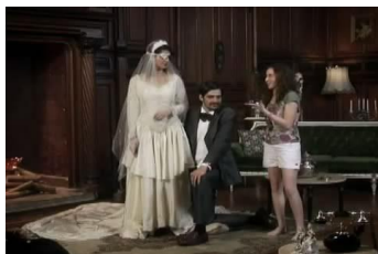
Figura 7- Cena da novela em que Thereza entra para explicar o romance.