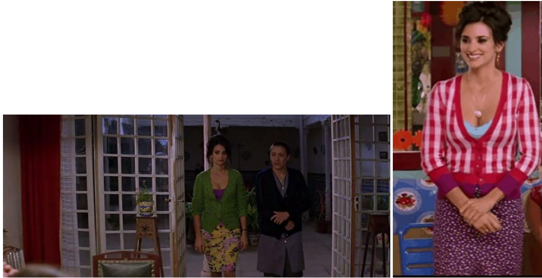
10. Figurino da personagem Raimunda: mistura de cores e estampas

essas mulheres que estão em todos os meus filmes, vêm todas da minha infância” (apud STRAUSS, 2008, p. 283).