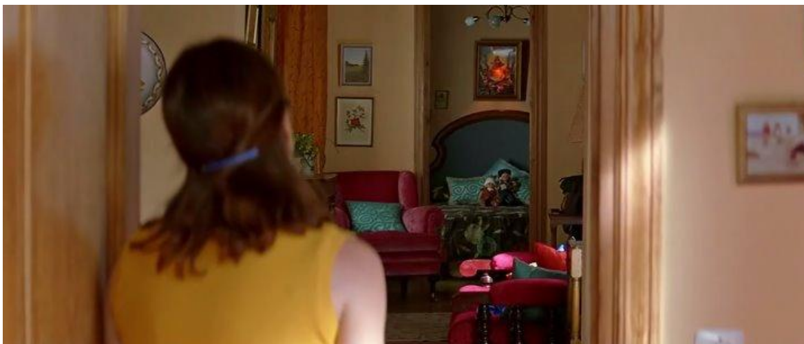
12. O quarto de Sole, que aparece ao fundo, possui um grupo de objetos kitsch: bonecas na cama, quadro de santo na parede, lustre e poltrona retrôs