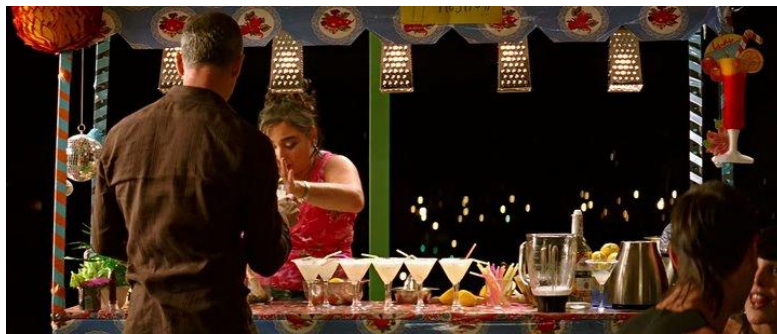
14. Cena da festa no restaurante de Raimunda e que reúne vários elementos kitsch na barraca que vende Morrito

No que diz respeito ao figurino, as referências ao kitsch são muito mais claras quando Almodóvar vai fazer crítica à cultura de massa no programa de televisão em que Agustina dá entrevista. “Hay también una crítica a la televisión a través de un programa titulado <Dondequiera que estés>, ejemplo de la telebasura que inunda la mayoría de las cadenas de televisión” (HOLGUÍN, 2008, p. 308). Em todo trabalho do diretor existe uma forte crítica à mídia e aqui ela está muito bem marcada pelos diálogos das personagens e sustentada pelo elemento kitsch do figurino.