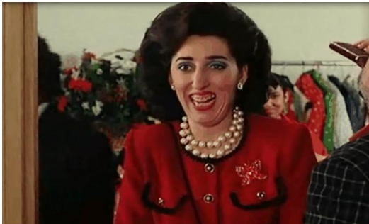
5. Personagem Rosa

Nos fotogramas abaixo, ainda do filme La flor de mi secreto , é possível ver também a presença do kitsch no figurino da personagem Rosa, irmã de Leo, uma típica proletária que imita a irmã burguesa ao se vestir, e que acaba tornando-se muito engraçada com isso.