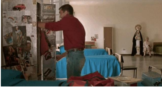
3. Do filme Kika