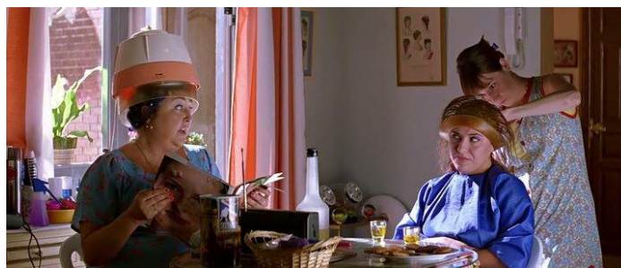
11. A sala da casa de Sole que se transforma em salão de beleza

Outro elemento kitsch da personagem está na adaptação que ela faz do seu apartamento para manter seu salão de beleza clandestino.