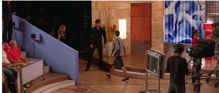
16. Figurino da personagem Agustina que é kitsch e rural

tem câncer. Ela percebe que foi um engano ter concordado com aquele espetáculo e sai no meio do programa sem dar explicações.