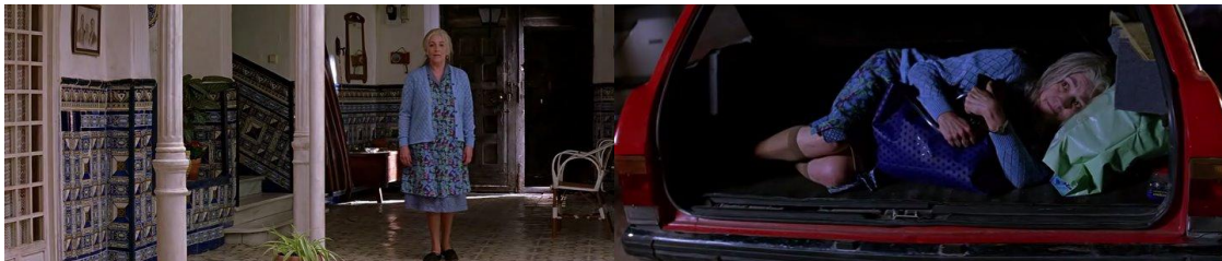
8. Personagem Irene nas cenas que aparece para a filha Sole.

É um filme essencialmente “manchego” – da região de La Mancha, Espanha – e emocional, ao provocar fantasias que dependem diretamente do texto – a mãe morta que nos retorna. “O surpreendente é que toda essa emoção está ligada à parte mais kitsch do filme, com aquele fantasma que retorna de uma comporta como uma pessoa normal” (apud STRAUSS, 2008, p. 290).