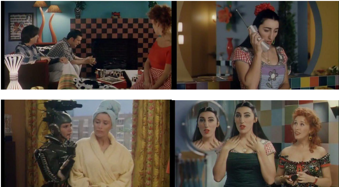
7. Do filme Kika