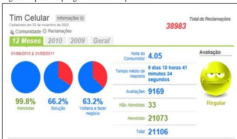
Fig. 03- representação gráfica da avaliação do consumidor

A empresa TIM, como as demais empresas de telefonia móvel está há muito tempo se revezando no ranking de piores empresas no atendimento e relacionamento com os seus clientes. Trata-se de uma área de negócios com uma forte concorrência centrada em promessas de benefícios e ganhos para os usuários, refém da dissonância cognitiva resultante do confronto entre o falar e o fazer. Afinal, temos 99.8% atendidos, contra 66,2% solucionados. Não impedindo manifestações como essa: TIM Liberty me aprisionou 8 - “[...] como podem me cobrar mais de R$ 300,00 reais de internet e apresentam propaganda na televisão que o preço é R$ 0,50 por dia (R$ 15,00 no mês).