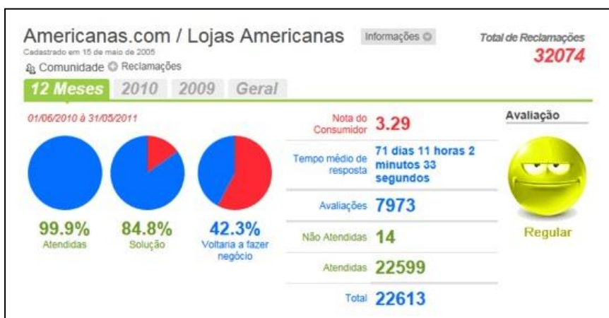
Fig. 02- representação gráfica da avaliação do consumidor

É possível visualizar na tabela 02 o significativo percentual de soluções, embora os consumidores atribuíssem uma nota baixa na avaliação. Também temos na figura a comprovação de um alto índice de consumidores (57,7%) que não voltariam a comprar. Essas avaliações seguem as observações livres dos consumidores através do site nuncamais.net, e como forma de ilustrar usaremos apenas um exemplo para cada uma das marcas envolvidas, neste caso foi selecionado uma manifestação denominada: Consumidor = otário 7 , “No dia 13/05 fiz uma compra no site... Os produtos foram enviados ... mas no dia previsto para entrega, apareceu uma mensagem no site... os produtos tinham voltado ... em função de 3 tentativas de entrega infrutíferas. Estranho, pois não houve tempo hábil para 3 tentativas, e na minha casa tem porteiro 24h... Nunca