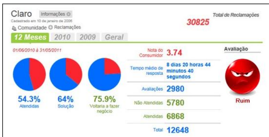
Fig. 05- representação gráfica da avaliação do consumidor

Esta é mais uma empresa de telefonia móvel que como todas as outras, deveria ser regulada pelas agências estatais, contudo quem sofre os viés de um atendimento precário são os consumidores que expostos a uma overdose de promessas, via publicidade, reagem diante da realidade constatada abaixo.