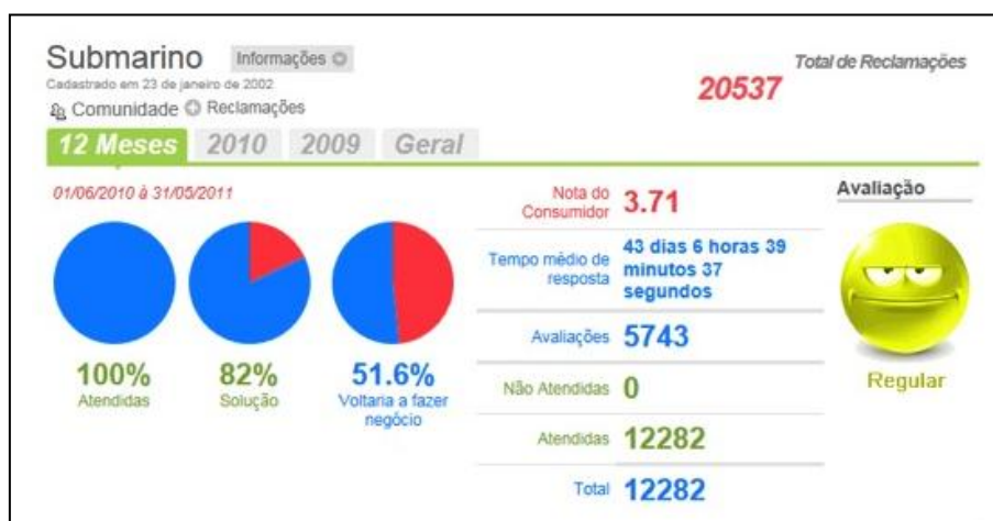
Fig. 06- representação gráfica da avaliação do consumidor

As observações realizadas nas empresas 01 e 03 somam-se a esta empresa que mesmo obtendo 100% de atendimento, solucionou apenas 82% dos problemas e apenas 51,6% voltariam a fazer negócios com ela. Como manifestação do consumidor, temos: Submarino- Propaganda Enganosa 11 “O site submarino me mandou um email no dia 27/04/2011 com a promoção da câmera 14.1 mp sony 4x zoom .panorâmica vídeo HD. com Swarovski com o preço de R$399,00 quando cliquei no produto para comprar... estava com o preço de R$ 599,00, eu ameacei entrar no PROCON por propaganda