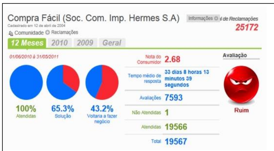
Fig. 04- representação gráfica da avaliação do consumidor

Esta empresa como as demais empresas de vendas on line, tem como seu maior limite a credibilidade, afinal, trata-se de um comércio virtual, ou seja, as variáveis tempo e espaço perdem o sentido, diante da possibilidade de aquisição de um bem ou produto. O consumidor conta com essa flexibilidade, traduzida por conveniência ou ganho, gerando, portanto, expectativas quanto a segurança e respostas rápidas. Passíveis de serem constatadas pela rejeição de 56,8% e pelo depoimento: Nunca mais recomendo esta empresa a ninguém 9 - “Há mais de um mês fiz uma compra no site da