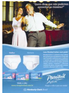
Figura 3 – Anúncio página simples – revista Veja – 10 de abril de 2010 – p. 35

Função conativa: “Quem disse que não podemos aproveitar ao máximo? Com Plenitud Active você pode!”