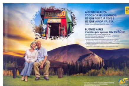
Figura 1 – Anúncio página dupla - revista Época - 9 de março de 2009 - p. 26-27

Função poética: A gente realiza todos os seus sonhos: os que você já teve e os que ainda vai ter.