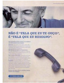
Figura 2 – Anúncio página simples - revista Época - 30 de março de 2010 - p. 61