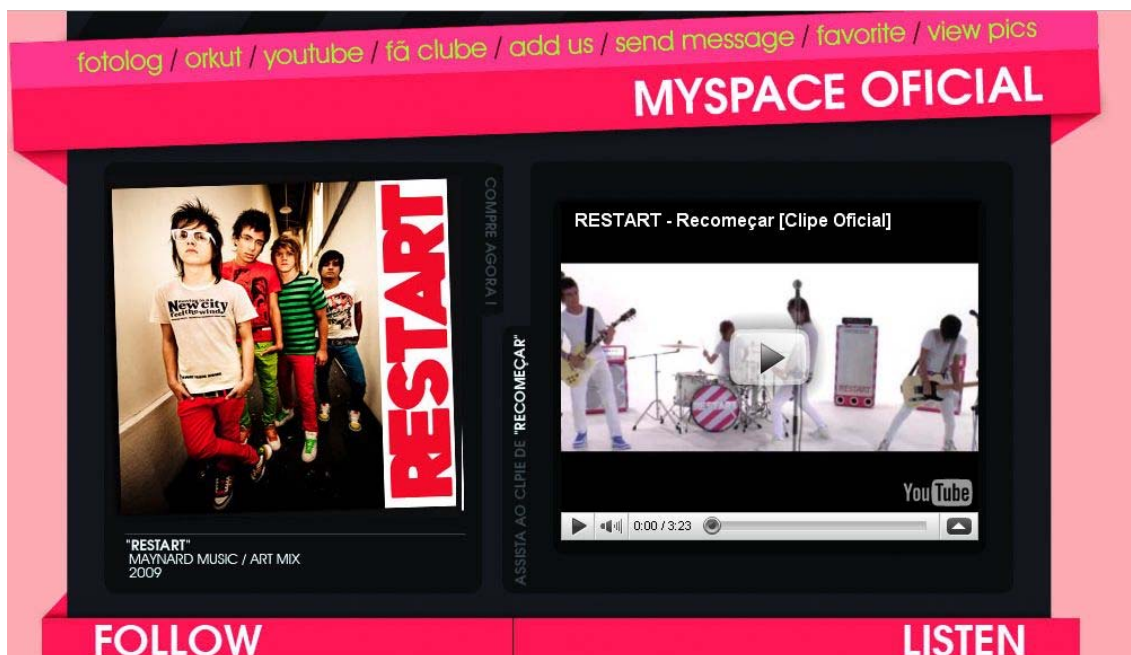
Imagem 1: Homepage da banda Restart no MySpace.

No geral, os perfis das bandas, dentro do MySpace, seguem a identidade visual das mesmas. Assim, o da Restart é extremamente colorido e vibrante, o que vai ao encontro do que os quatro músicos vestem. Logo na área inicial da página, é possível ver a capa do CD do grupo. Ao lado, o link para um clipe que também está no YouTube e, logo abaixo, vem o player do MySpace, espaço onde bandas independentes podem incluir suas faixas musicais gratuitamente. Neste player , o usuário pode, além de ouvir via streaming e acrescentar a música a uma lista própria de reprodução, compartilhar a faixa com outros usuários, o que já configura, em si, uma forma fácil e rápida de disseminar a canção. O site possibilita a customização de fundo de tela e a inserção de recursos elaborados, como boxes de visualização dos últimos comentários feitos pelo artista em seu perfil no Twitter (como pode ser visto na área esquerda da imagem 2).