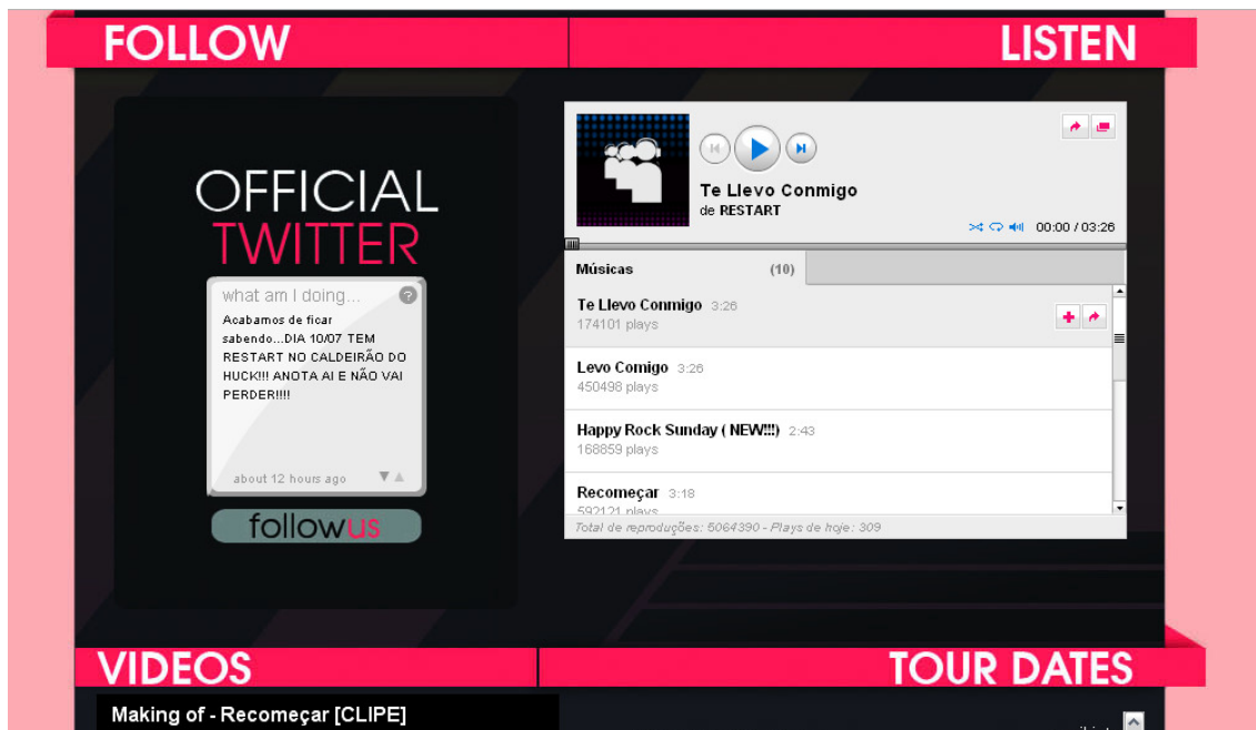
Imagem 2: Homepage da banda Restart no MySpace. No player , à direita, em cada faixa musical há dois botões. O primeiro (um sinal de adição) acrescenta a faixa a uma das listas de reprodução do usuário. O segundo (uma seta para direita) permite o compartilhamento com outros usuários.

exemplos de material que o usuário-produtor pode oferecer ao usuário-consumidor que navega pelo MySpace para que este possua um universo de possibilidades de consumo de informações da banda.