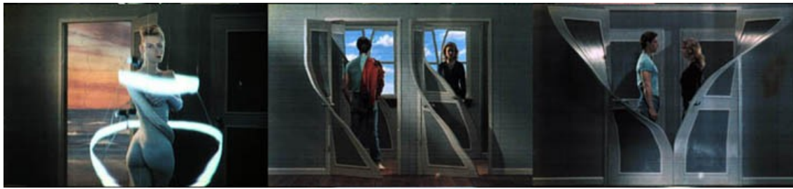
Frames do vídeo Fourth Dimension

imagens fantásticas, como o de uma porta abrindo como um zíper abre uma jaqueta.