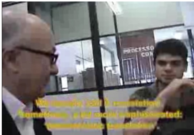
Frame do vídeo Musical Dada Baitello 5 , produzido pela banda Musical Amizade (2008).

Mas enfim, o que se passa na compactação? Ao contrário de seus antecessores, como já dissemos, o fluxo do panorama audiovisual dos vídeos compactados para internet é constituído por partes da imagem em movimento e outras partes estáticas, que se atualizam somente quando surge um novo código de cor (numa troca de plano ou num movimento mais brusco da câmera, por exemplo). Uma compressão mais forçada, que gera um arquivo menor, causa uma sujeira na imagem, como podemos ver abaixo: