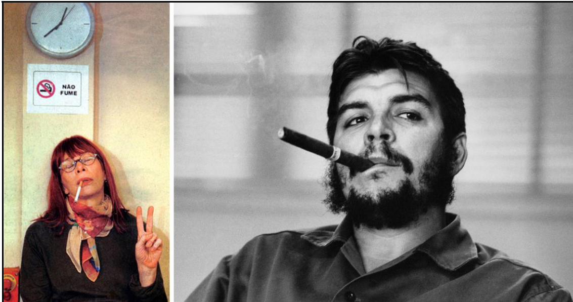
FIGURA 4 – RITA LEE E CHE GUEVARA