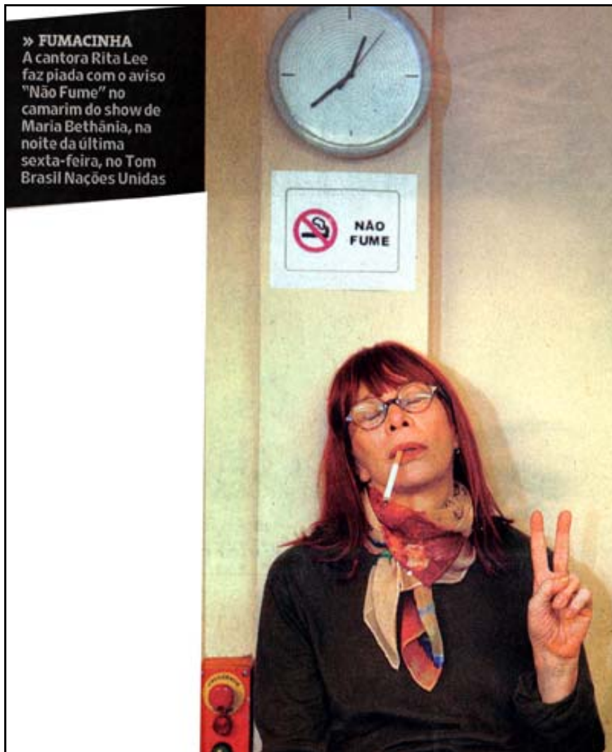
FIGURA 1 – FOTOGRAFIA DE RITA LEE