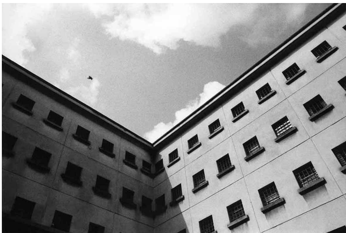
(fig.04) A inversão desta imagem e seu rebatimento em uma página espelhada acentuou a espacialidade.