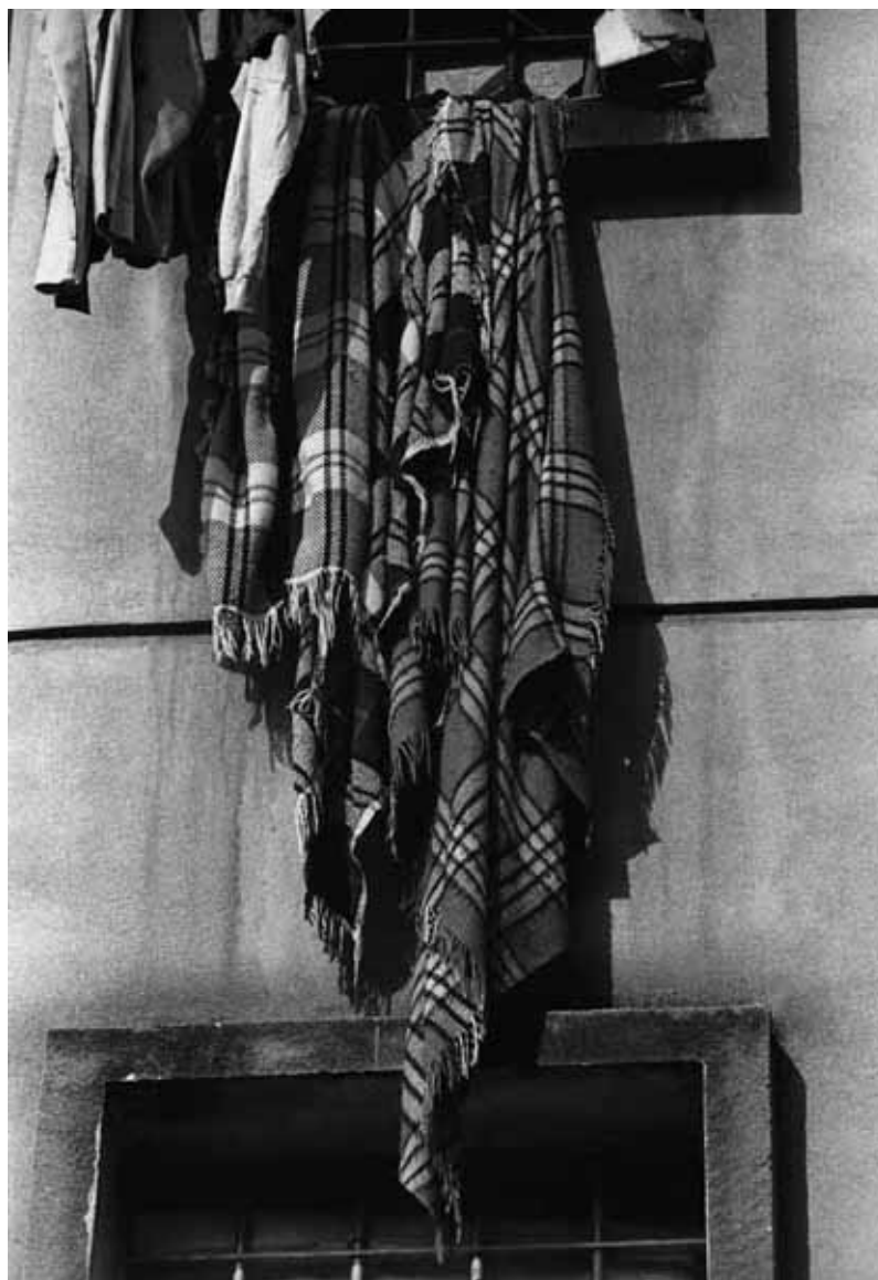
(fig. 01) Objetos emolduram o imaginário do cárcere. Na edição, a imagem rente à margem superior, leva o olhar para o alto das grandes janelas – grades a separar o mundo exterior.

Certamente muito a percorrer. "Deter-se, e depois partir de novo: eis o que é pensar." (Valéry, 1997: 119).