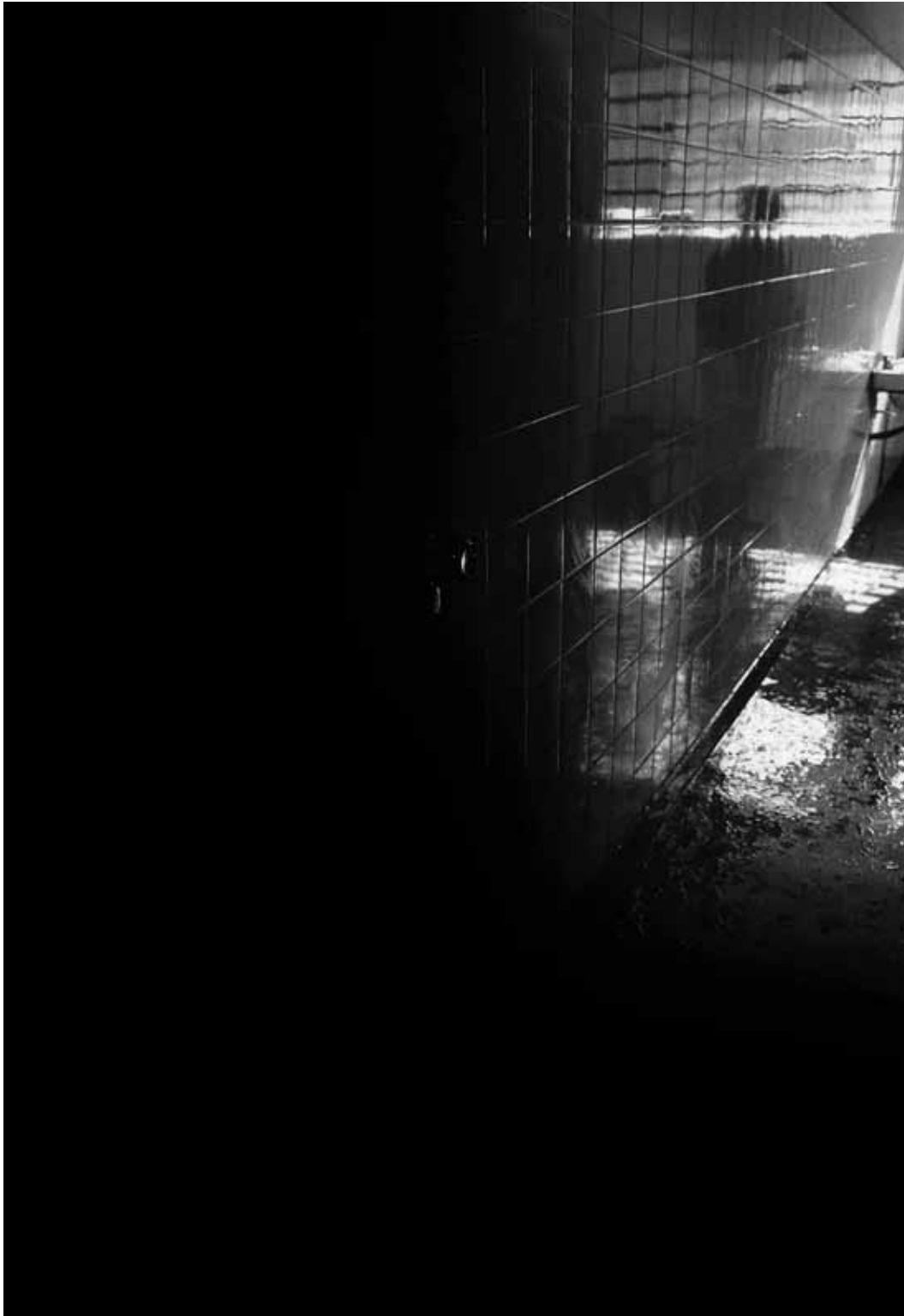
(fig.02) A exclusão é marcada por luzes, sombras e vazios.