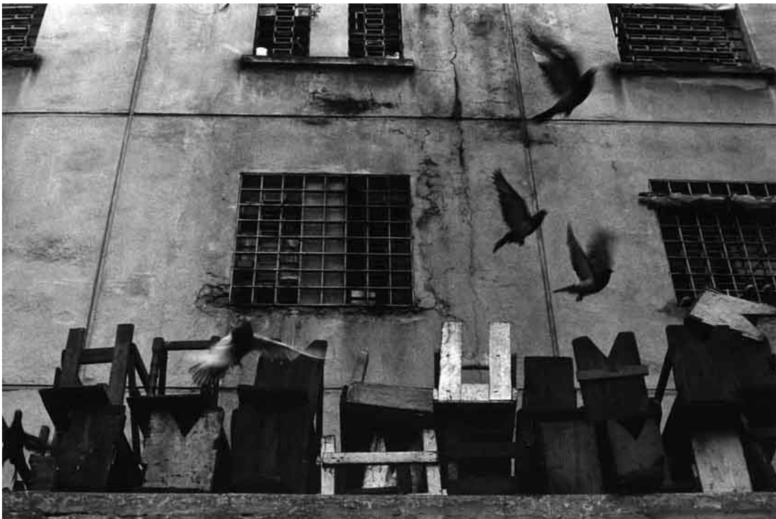
(fig. 06) Imagens que fecham a edição de Deter-se : provável referência a O pouso do pombo , de Kertész.