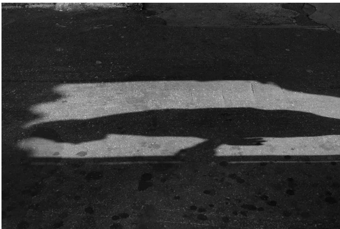
(fig.03) No confronto entre intenção e realização, os retratos deram lugar à exploração do ambiente.