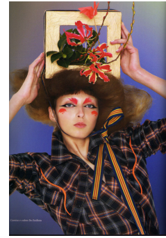
Ilustração 2 - FFw Mag- Foto Modelo Japão.

A foto escolhida tem como característica estar impressa em cores, apresenta uma modelo caucasiana de olhos azuis, vestida com uma camiseta xadrez, segurando com as duas mãos em cima de sua cabeça um adorno com flores que remetem à cultura do Japão. A modelo está posicionada frontalmente com relação ao seu rosto e o corpo transparecendo uma leve inclinação à esquerda da fotografia.