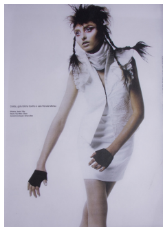
Ilustração 6 – Catarina – Foto Global Fonte - Revista Catarina ano 2009 pg. 68

Desta forma a intensidade da luz nesta fotografia foi considerada, portanto como uma exposição equilibrada.