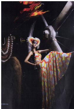
Ilustração 5 – Catarina - Foto Carnaval

Já a intensidade do contra-luz se caracterizou como sendo superexposto por eliminar os detalhes de informação onde ele atinge.