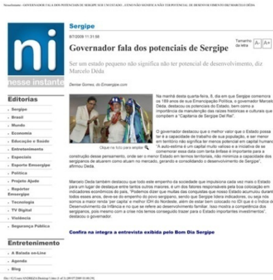
Página de Notícias locais