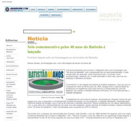
Página de Esportes