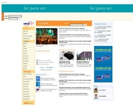
Página de Cultura

Fonte: layouts retirados do site www.emsergipe.com