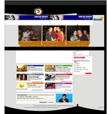
Página de Hot site

Fonte: layouts retirados do site www.emsergipe.com