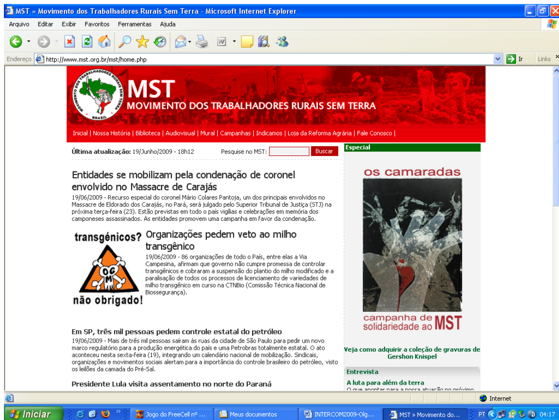
Ilustração 5: Disponível em: < http://www.mst.org.br > Acesso diário.