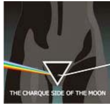
Imagem 02 -Capa de "The Charque Side of the Moon"