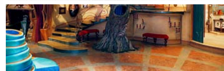
Figura 3: Sala de estar, com a árvore-mãe