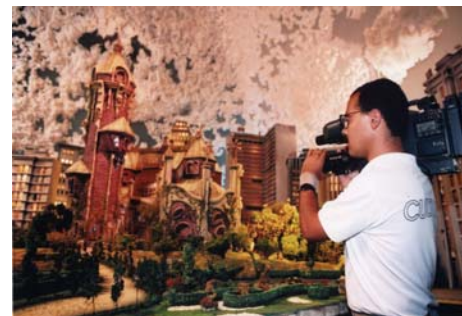
Figura 4: Gravação da vinheta de abertura do programa

Arquitetura, o que permitiu uma perfeita integração entre construção e fantasia. Assim, o desvendamento das peculiaridades de cada cômodo está atrelado à personalidade dos moradores que mais o usufruem, fato que justifica a escolha dos objetos ali colocados e tipo de decoração aplicada, sendo este o recurso que será utilizado para a descrição da cenografia do programa em estudo.