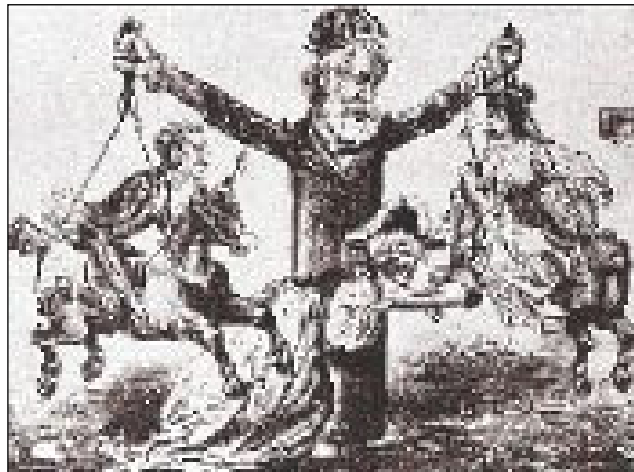
Charge de Aluísio Azevedo, publicada em O Mequetrefe

Iniciando sua vivência no meio jornalístico, Azevedo começa como caricaturista em jornais cariocas e registram algumas fontes que ele, posteriormente, passou a compor a personalidade de seus personagens por meio das caricaturas. Os jornais O Fígaro e O Mequetrefe contaram com suas caricaturas.