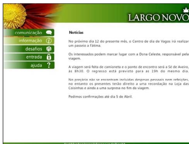
Figura 3 – aspecto do layout do portal “Largo Novo”

Na fase 2 foram elaborados os requisitos funcionais e técnicos da ferramenta colaborativa em causa. A resolução escolhida para o portal foi de 800X600 pixels . Apesar de estatisticamente não ser a mais usada 9 foi escolhida porque se considera que esta resolução é aquela que representa o tamanho com o melhor compromisso com apresentação a informação e as características do público-alvo em questão.