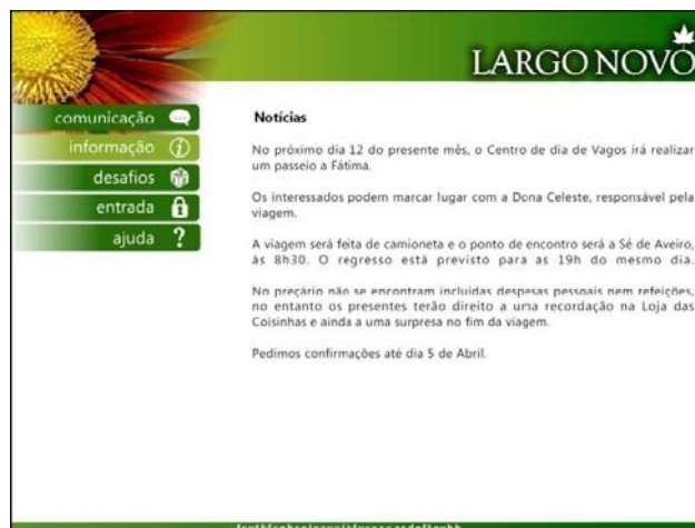
Figura 3 – aspecto do layout do portal “Largo Novo”

Na fase 2 foram elaborados os requisitos funcionais e técnicos da ferramenta colaborativa em causa. A resolução escolhida para o portal foi de 800X600 pixels . Apesar de estatisticamente não ser a mais usada 9 foi escolhida porque se considera que esta resolução é aquela que representa o tamanho com o melhor compromisso com apresentação a informação e as características do público-alvo em questão.