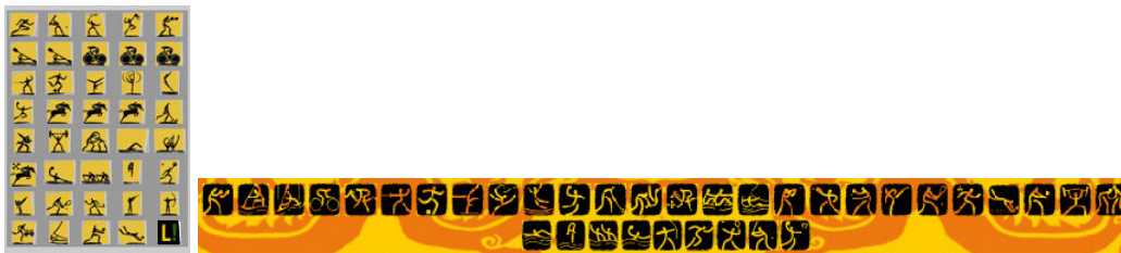
Figuras 14 e 15: ícones de demonstração das modalidades em 2004 e 2008, respectivamente.

Em ambos casos a área central da página preocupa-se em expor as notícias atualizáveis, deixando às laterais o acesso às informações diversas. Pensando ainda no aspecto gráfico, podemos destacar que a identidade icônica das modalidades foi mantida. Desenhos representam cada modalidade como uma marcação temática do conteúdo veiculado.