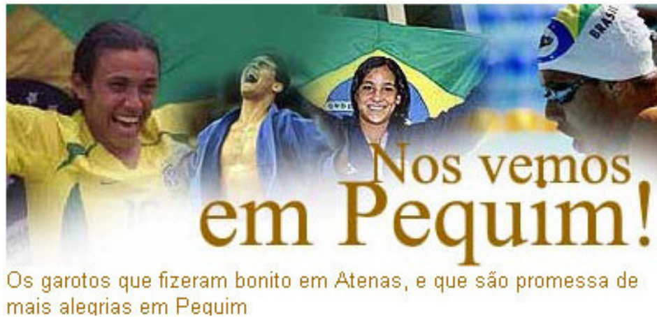
Figura 1 – chamada para notícia “nos vemos em Pequim” (11/09/2004)

intitulada “Nos vemos em Pequim” veiculada tão logo foram terminados os Jogos Olímpicos de Atenas em 2004, noticiando um balanço geral da competição e projetando as promessas olímpicas brasileiras para 2008.