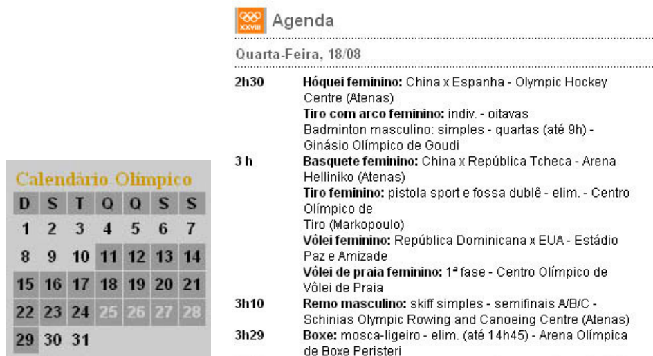
Figuras 7 e 8 – “Calendário Olímpico” e “Agenda”, em 18/08/2004.

De marcante à memória (a possibilidade do site de permitir acesso a informações passadas, não se limitando às últimas notícias publicadas. Está diretamente ligada a uma idéia de acúmulo de informações acessíveis), observamos o “Calendário Olímpico” (Figura 7), no qual era possível acessar o que o próprio Lancenet chamou de “agenda” (Figura 8), mesmo depois de passadas as disputas. As datas eram demarcadas pela diferenciação de cor. Passada aquela determinada data, alterava-se o marcador para a cor preta que inicialmente era cinza claro, que se confundindo com o fundo, dava-nos uma idéia de preenchimento.