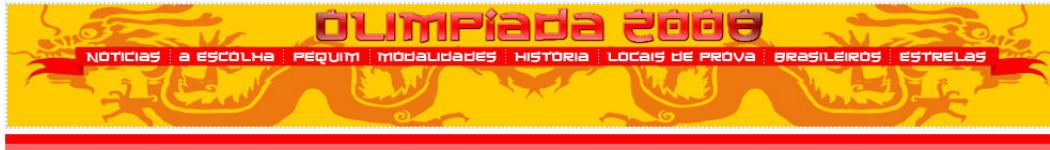
Figura 16: banner de identificação do site “Pequim-2008” em 26/05 de 2008