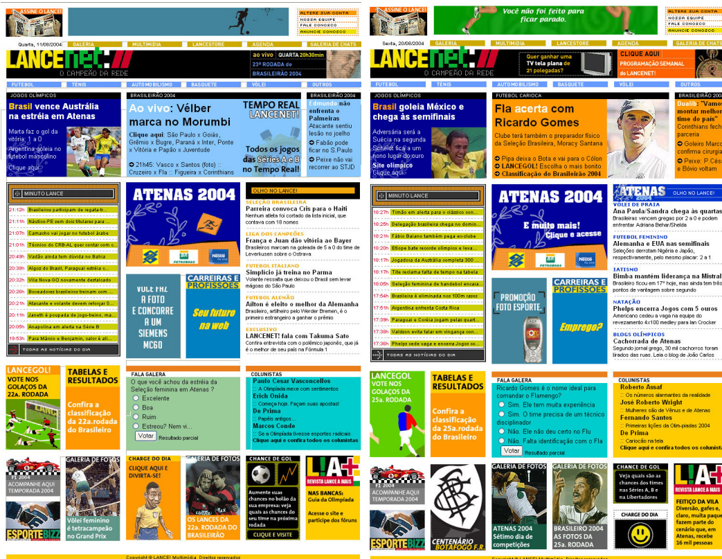
Figuras 3 e 4 - Páginas iniciais do Lancenet nos dias 11/08/2004 e 20/08/2004.

Durante os Jogos, conforme o exemplo do dia 20 de agosto, foi veiculada na página inicial do Lancenet a seção “Atenas 2004 – Olho no Lance” na coluna da esquerda (terceira), que trazia sempre cinco notícias dos Jogos em substituição da seção chamada apenas de “Olho no Lance” que ocupava o mesmo espaço anteriormente, conforme exemplificam as figuras 3 e 4.