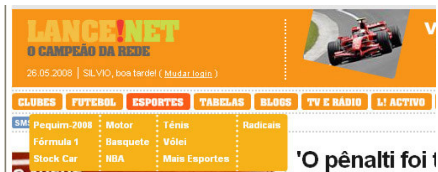
Figura 12 – Chamada para a Seção Pequim-2008 do Lancenet em 26/05 de 2008.

Ainda que discretamente, exposta no fim de Maio, podíamos encontrar dentro do Menu “Esportes” a chamada para uma seção específica denominada “Pequim-2008”, que nos levava a uma Página específica dos Jogos Olímpicos de 2008, semelhante ao que se encontrava com a página “Atenas 2004” exposta anteriormente.