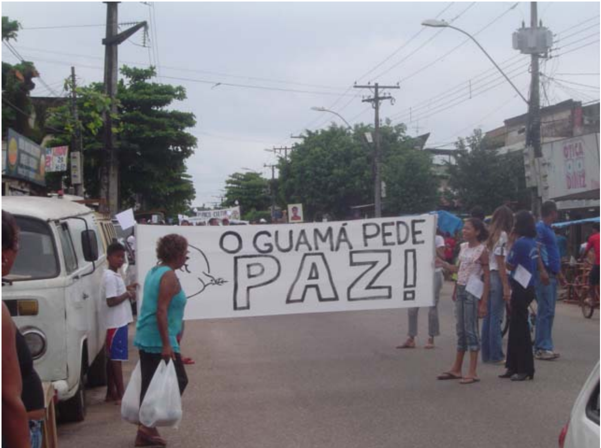
Manifestação dos moradores do bairro contra a onda de violência local

Após a finalização do projeto piloto, ainda em processo, a equipe apresentará a proposta para os comerciantes locais do bairro a fim de que estes se tornem anunciantes, e a partir disso, conseguir patrocínio para a confecção do produto e distribuí-lo gratuitamente entre os moradores do bairro.