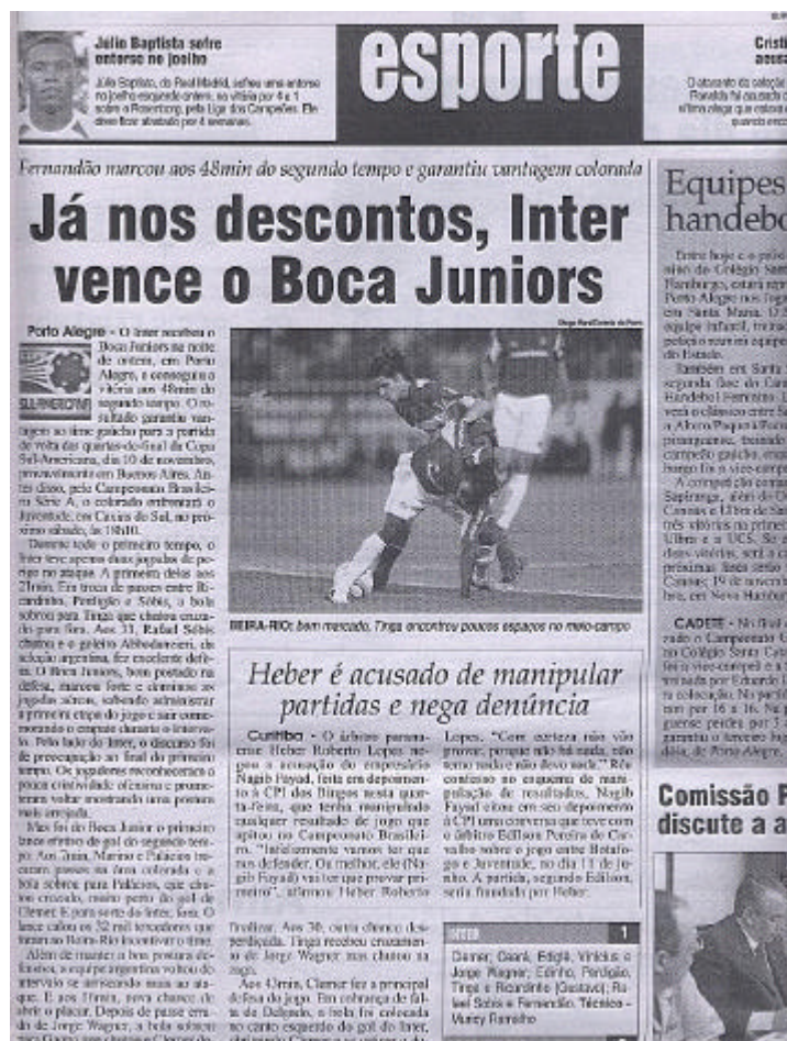
Figura 1 – Capa da Página de Esportes do Jornal NH veiculado no dia 20 de outubro de 2005.

Como informação central do dia anterior, no espaço esportivo, está o jogo da Copa Sul-Americana entre Internacional de Porto Alegre e Boca Juniors da Argentina. Sobre esse jogo, o Jornalista A destacou que o gol do Fernandão contra o Boca no último minuto da partida provocou uma mudança no lide e em parte do texto que já estava pronto para relatar o zero a zero do placar. Já estava produzido o título para o empate: “Inter não consegue vencer a marcação do Boca”, mas em função do gol do Inter e, conseqüentemente, da vitória, o título foi alterado, ficando: “Já nos descontos, Inter vence o Boca Juniors” (Figura 1).