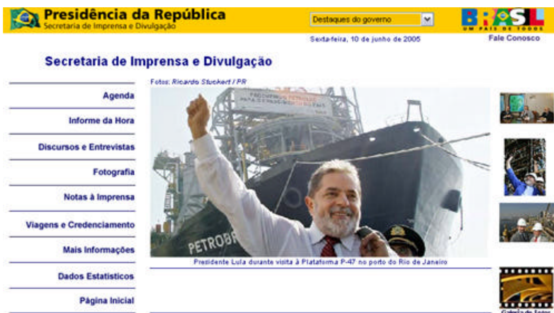
Figura 2: Site da Secretaria de Imprensa e Divulgação (www.info.planalto.gov.br)

Para reduzir parte da demanda por informações e agilizar o atendimento aos jornalistas, a SID inaugurou, em setembro de 2003, uma página na internet (ver Figura 2). Durante 15 meses de funcionamento, o site da Secretaria publicou 528 agendas do presidente, 2.205 notas, 2304 fotografias e 190 programas de viagem 6 .